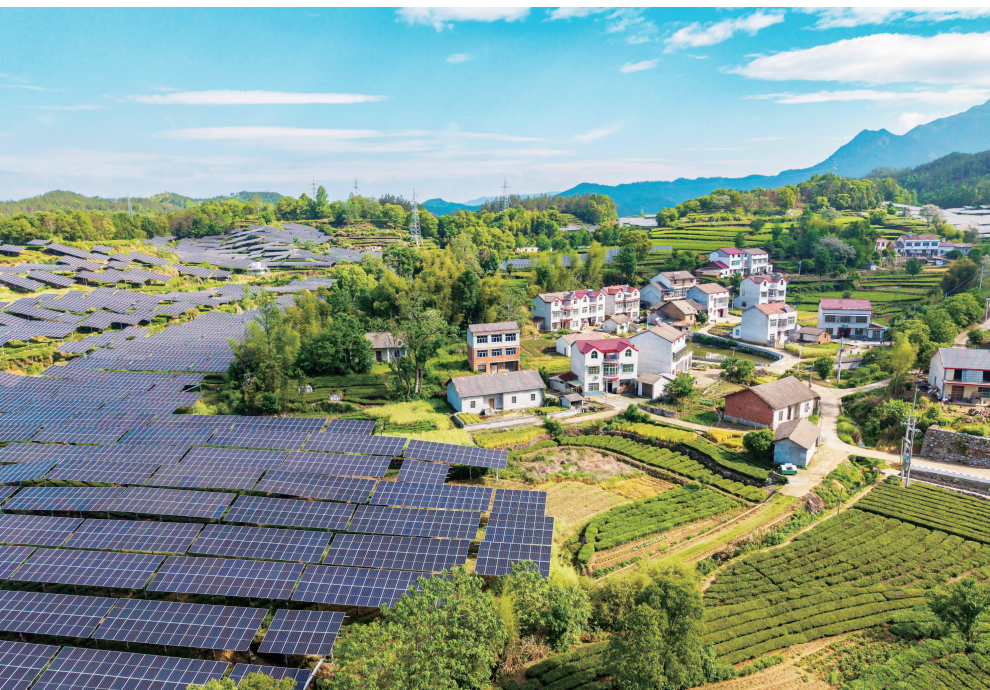
▲黄冈市英山县杨柳湾镇茶叶谷村，茶园与光伏板、民居交相辉映，构成一幅乡村振兴新画卷。

个，占全国总数的5%，居全国第一方阵。全省社会化服务组织3.7万个，农业生产托管面积7245.07万亩次，同比增长8.51%，服务小农户460.6万户次。