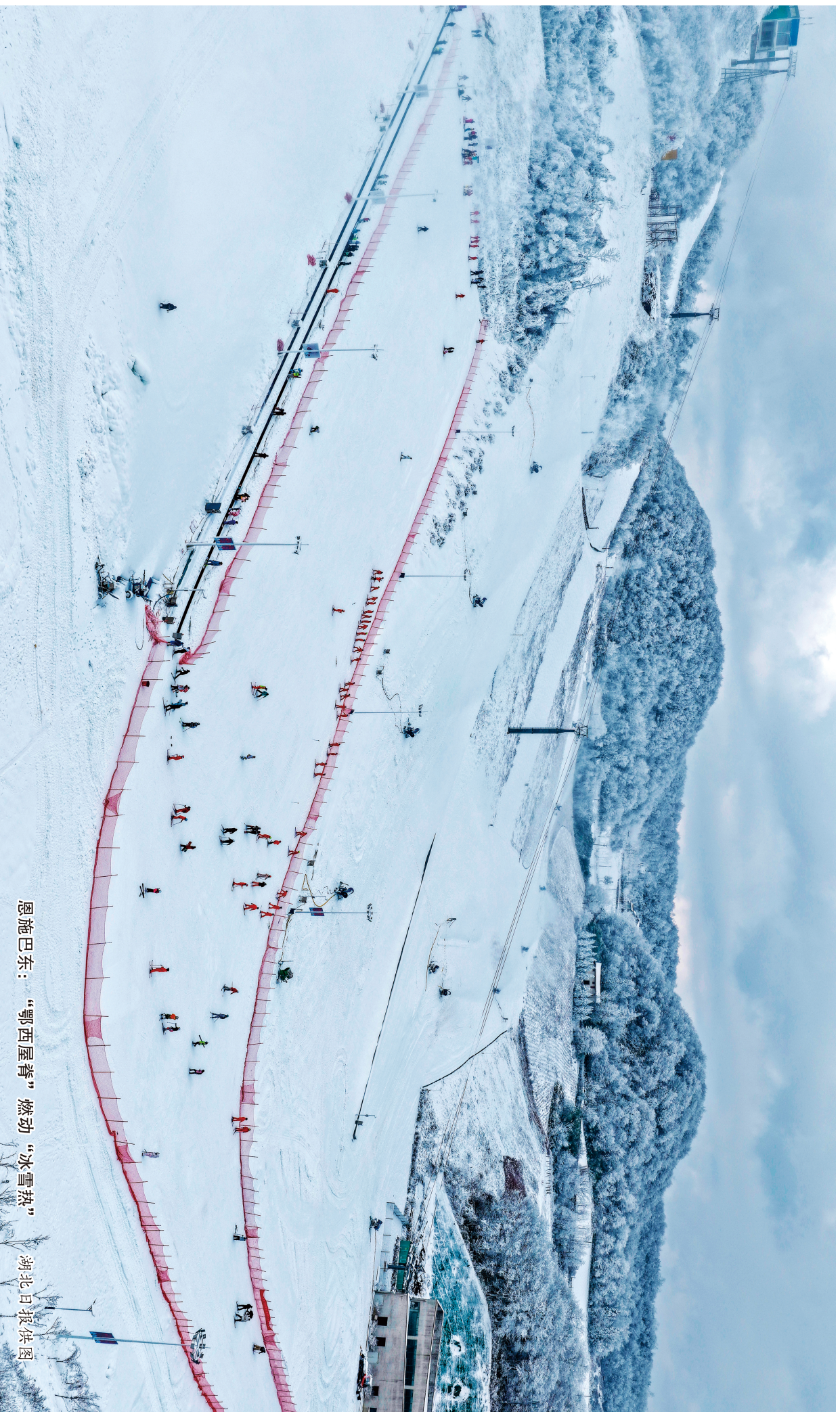
恩施巴东：“鄂西屋脊”燃动“冰雪热”