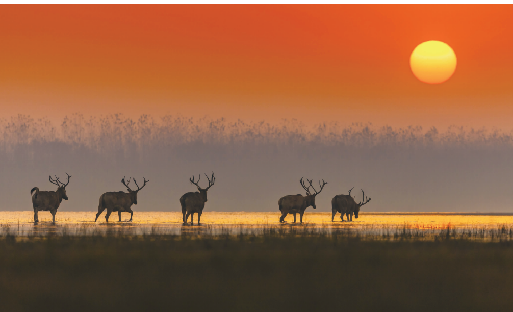
▲清晨，一群麋鹿漫步在石首长江故道。近年来，随着生态环境的持续改善，石首天鹅洲湿地麋鹿国家级自然保护区的麋鹿达4500余头，其中野外扩散种群达1600余头，形成全球最具规模与活力的野生麋鹿种群。