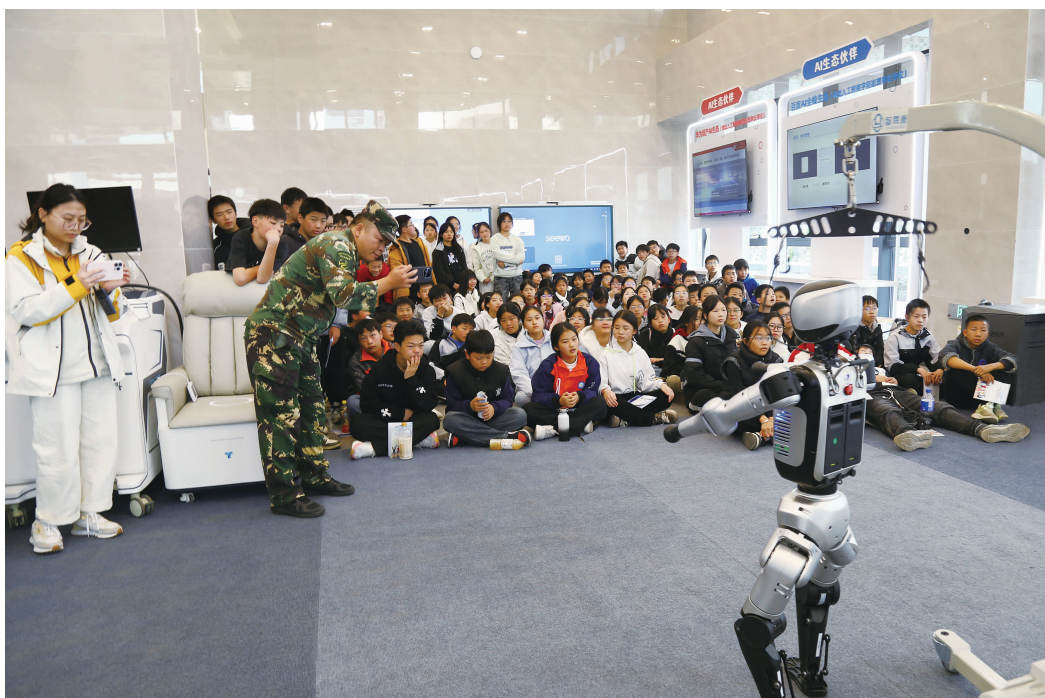
▲鄂州市鄂城区抢抓人工智能发展机遇，依托北京大学、北京通用人工智能研究院等顶尖学术资源，协同创办湖北莲花山人工智能研究院。图为 2025 年 9 月 27 日，湖北莲花山人工智能研究院首届科技开放日，鄂城区小学生观看机器人太极表演。

家，科创企业呈现爆发式增长，鄂城钢铁公司连续三年获评湖北省高新技术企业百强，荣获省级科技进步成果二等奖 4 项、三等奖 3 项，欧冶链金连续两年获省级制造业高质量发展工业重大增长点，程潮矿业一技术创新成果荣获第 11 届国际发明展览会铜奖。二是以攻克“卡脖子”的决心畅通成果转化。深化“研发在武汉、转化在鄂城，总部在武汉、生产在鄂城”的协同模式，依