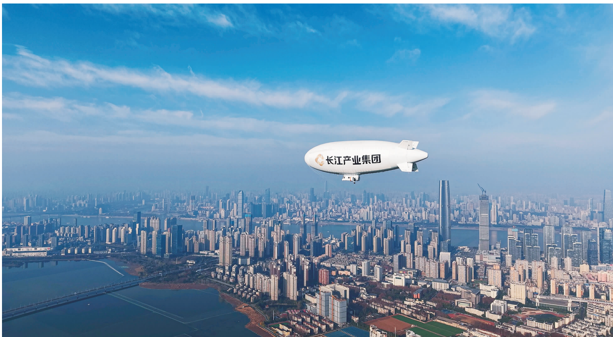
▲长江产业集团旗下的长江航特低空飞行器科技有限公司，积极布局低空经济新赛道，成为国内首家飞艇商业运营商。图为2026年1月9日，长江航特AS700飞艇在武汉完成全国首次载人飞艇商业飞行展示。