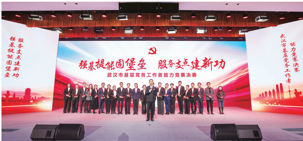
▲湖北将2025年作为“干部素质提升年”，用更高定位、更高标准、更高要求抓干部队伍建设。全省各地各部门积极落实省委“干部素质提升年”要求，聚焦凝心铸魂、对标争先、强基提能等“六大行动”，系统推进各项举措，展现了“竞”的姿态与“进”的步伐。图为2025年11月28日晚，武汉市基层党务工作者能力竞赛决赛现场。

牢牢把握“围绕什么选人”的问题。用干部是为了干好事业，坚持事业为上是选人用人的根