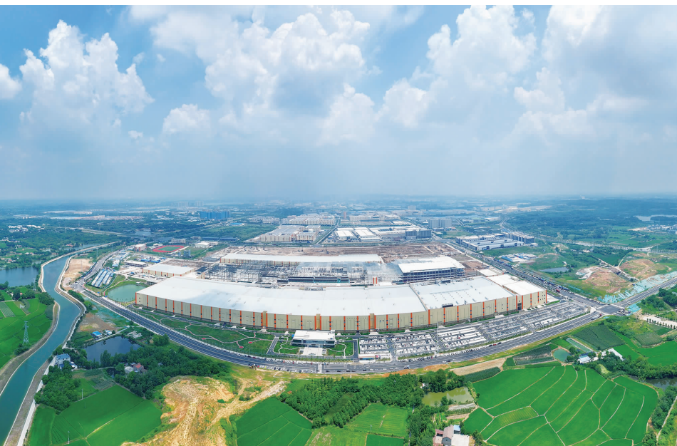
▲2025年12月26日，荆门高新技术产业开发区成功入选《国家级零碳园区建设名单（第一批）》，成为省内唯一一家国家级零碳园区。本次申报工作由宏泰集团旗下湖北碳交中心牵头，联合亿纬锂能、格林美等产业链龙头企业协同推进完成。图为荆门高新技术产业开发区鸟瞰图。

发展动能。支撑全国碳市场首次扩围，钢铁、水泥、铝冶炼三大行业 1334 家重点排放单位 100% 纳入，覆盖碳配额总量从 52 亿吨跃升至 80 亿吨，占全国二氧化碳排放总量的 60% 以上。牵头成立全国首个碳金融联盟，创新推出 10 余类碳金融产品，“鄂绿通”平台申报项目 848 个，累计助力企业融资 1531 亿元。建成华中地区首个省级碳足迹服务平台，实现产品碳足迹核算、认证、标签和披露等一站式服务。打造 200 余个碳中和场景，支持荆门锂电循环产业园成功申报成为省内唯一一家国家级零碳园区。