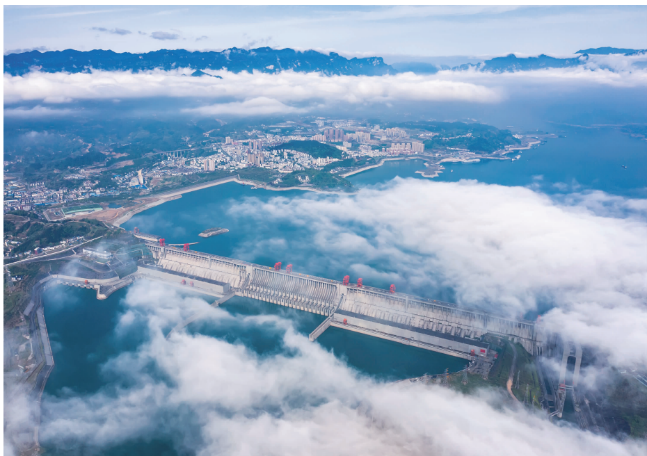
▲高峡平湖，烟波浩渺。三峡水库蓄水至目前的高水位运行后，库区航道水深增加，江面拓宽，通航条件改善，万吨级船队可从宜昌直达重庆，长江黄金水道日益成为畅通国内国际双循环的大动脉。

强化绿色保障，完善服务链条。长航局致力于构建覆盖能源补给、污染物接收、应急保障、数字监管的全链条绿色服务保障体系。推动在长江干线建成 20 座水上综合绿色服务区、13 座水上危化品船舶洗舱站、8 座 LNG 加注站、1 座船舶加氢站以及一批船舶充换电站，为绿色船舶运营提供了有力支撑。建成并运行“绿色船舶监测”“船用能源加注”等数字化平台，逐步打通绿色航运的“最后一公里”，实现对污染物“来源可溯、去向可寻”，对绿色船舶“动态可监控、服务可直达”，初步构建起“船、港、城”一体