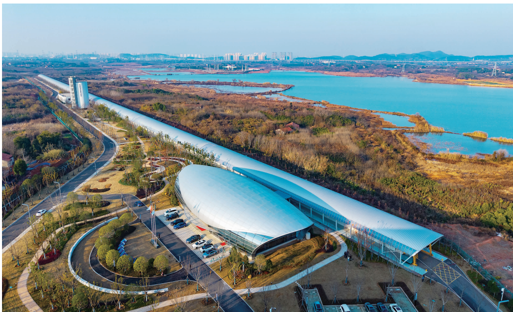
▲湖北是国家战略科技力量布局的重镇，建设具有全国影响力的科技创新高地是政治责任、时代重任。全省各地各部门鼓足干劲、拼搏奋进，努力为科技强国建设作贡献。湖北东湖实验室通过悬浮支撑和电磁推进的方式，仅用5.3秒就将1110公斤重的高铁模型车加速至每小时800公里，实现半年三破世界纪录。图为湖北东湖实验室高速磁悬浮测试线。

梁的责任担当。一是应对有效需求不足，扩大内需稳增长。面对国内供强需弱的突出矛盾，湖北将扩大内需作为战略基点，构建“消费扩容+投资提质”双轮驱动格局。消费端通过实施城乡居民增收计划、创新消费场景，推动产品供给与消费需求动态适配，精准破解消费潜力释放瓶颈。投资端严把项目质量关、效益关，推动政府投资与民间投资协同发力，既布局重大项目筑牢长远根基，又加快短期见效项目落地，实现当期稳增