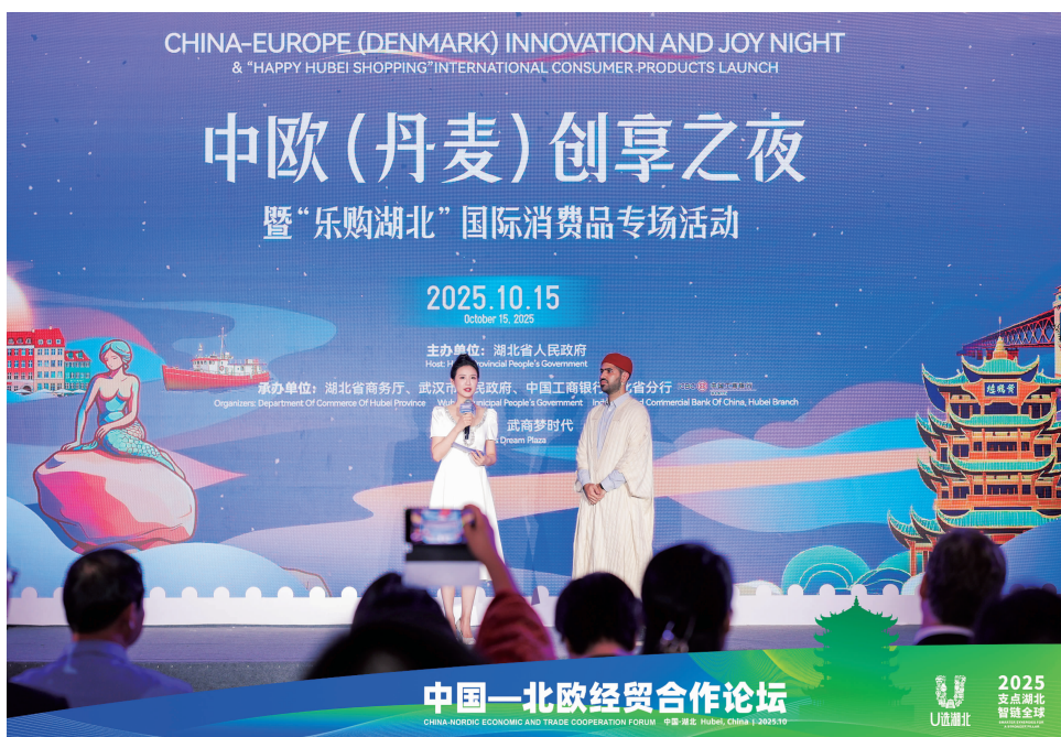
▲2025年10月15日，中欧（丹麦）创享之夜暨“乐购湖北”国际消费品专场活动在武汉举行。该活动融合文化、商品、科技与美食，串联欧洲精品与中国智能科技，既展现中欧商贸合作前景，也为湖北深化国际合作、打造内陆开放新高地提供了平台。

(三) 拓展双向投资空间，加快提升产供销合作水平。面向全球精准招商。聚焦“51020”先进制造业产业集群和五大现代服务业产业集群，大力开展精准招商和楚商回乡。塑造吸引外资新优势。推进新一轮服务业扩大开放综合试点任务，深化合格境外有限合伙人试点。办好“相约春天赏樱花”经贸洽谈、中国—北欧经贸合作论坛等重大活动，擦亮“投资中国 优选湖北”