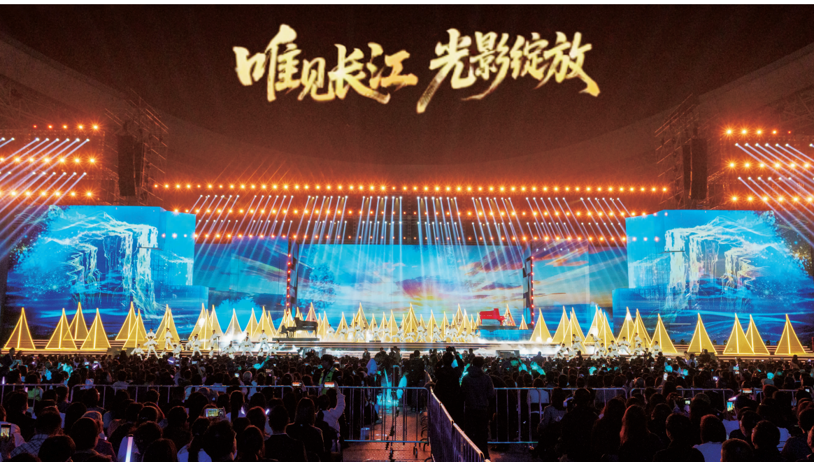
◀ 宜昌市坚持以文塑旅、以旅彰文，充分发挥文化旅游的强大牵引作用，加快打造世界知名文化旅游目的地。图为 2025 年 10 月 30 日晚，2025 长江文化艺术季闭幕式 & 中国电影大数据暨电影频道 M 榜荣誉之夜活动现场。

四、坚持市域和圈群协同联动，全力增动能。 着眼全省“一盘棋”谋发展，加快形成区域协调、城乡融合、优势互补、各展所长的发展格局。一是提升城市能级。坚持以城建城、以城养城、以城兴城，着力构建产业升级、人口聚集、城市发展良性互动机制。加强重要片区、重要枢纽、重要界面、重要节点规划设计与空间管控，充分保障新质生产力发展空间。持续推进城市更