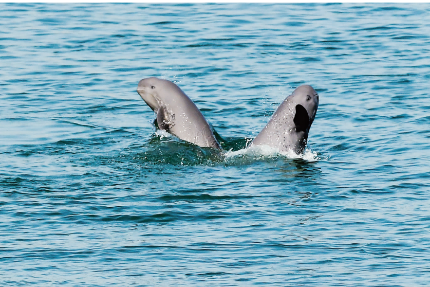
▲从沿江各地的破局探索，到全省上下的联动共治，长江水域的“微笑天使”江豚频频现身、逐浪嬉戏，为长江大保护写下最鲜活生动的注脚。

施，督促船舶交付污染物年均约 80 万吨，从根本上解决船舶对长江造成的水域污染。对常年航行长江的 3.6 万余艘次船舶污水排放管系进行铅封，确保船舶产生的污染物存放在船舶储存装置内，使之不能排；推动建设 3300 处船舶污染物固定接收装置和 167 艘移动接收船，畅通交付渠道，使之能交付；推广应用船舶水污染物联合监管与服务信息系统，推行船舶水污染物交接转处电子联单，使之可监控。推行洗舱信息系统，对危险品船舶洗舱进行全过程监控，确保船舶应洗尽洗、洗舱水应交尽交，实现洗舱水“零排放”。“零排放”模式生产良好的生态效益、经济效益和社会效益，得到广大航运企业的认可和社会各界的肯定，目前已向长江支流和其他内河水域推广。