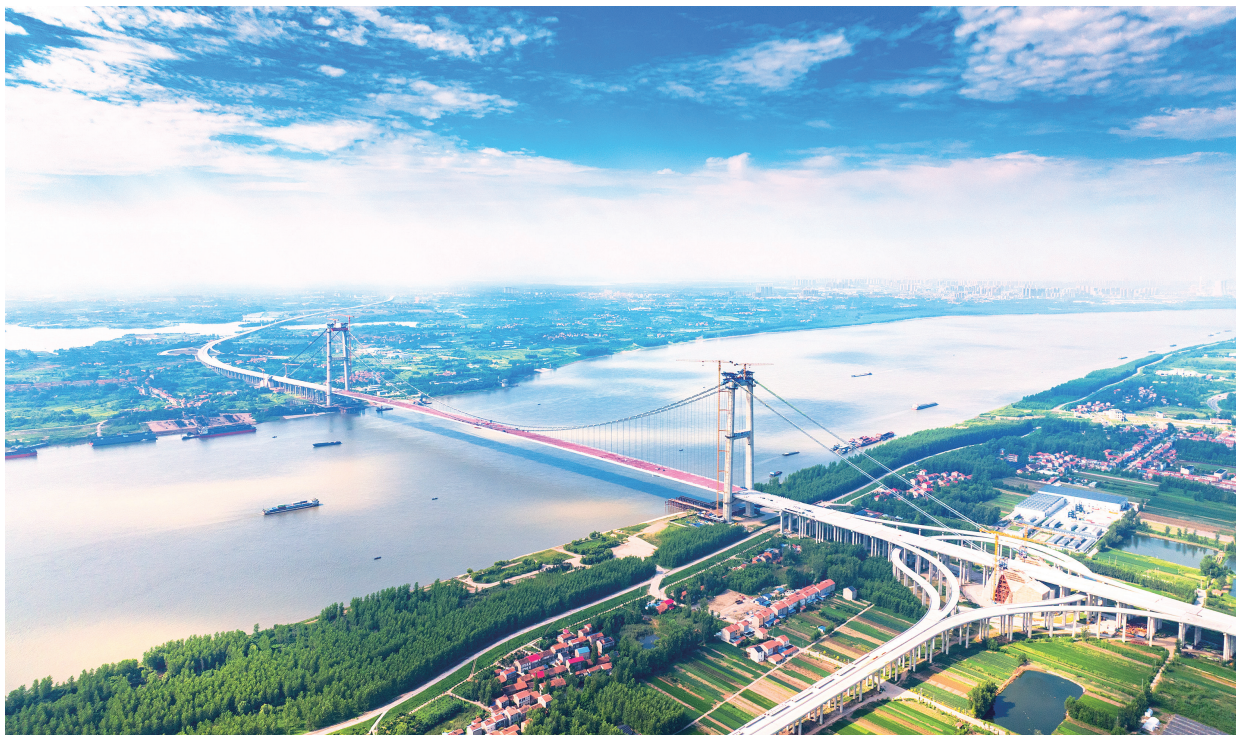
▲整体提升支点的开放辐射力，离不开综合交通的强大支撑。“十四五”前四年，湖北交通固定资产投资完成7897亿元，同比增长43%，公路水路投资连续两年居中部第一。图为双柳长江大桥。

在湖北提出全面深化改革“五大关系”和六个需要研究的重大问题。2016年，习近平总书记主持中央全面深化改革领导小组第二十一次会议，听取湖北省委关于建立和实施改革落实督察机制情况的汇报。2024年，习近平总书记考察湖北时强调，“湖北要在全面深化改革和扩大高水平开放上勇于探索”，“坚持对内对外开放并重、打造内陆开放高地”。“十五五”时期，湖北需增强实践探索自觉，争取在进一步全面深化改革的三个前沿领域走在前列。一是努力在深化要素市场化配置改革上走在全国前列，建设要素市场化配置改革高地。二是努力在建设内陆制度型开放高地上走在全国前列，构建面向共建“一带一路”的制度型开放平台。三是努力在培育新质生产力上走在全国前列，建设新质生产力发展高地。