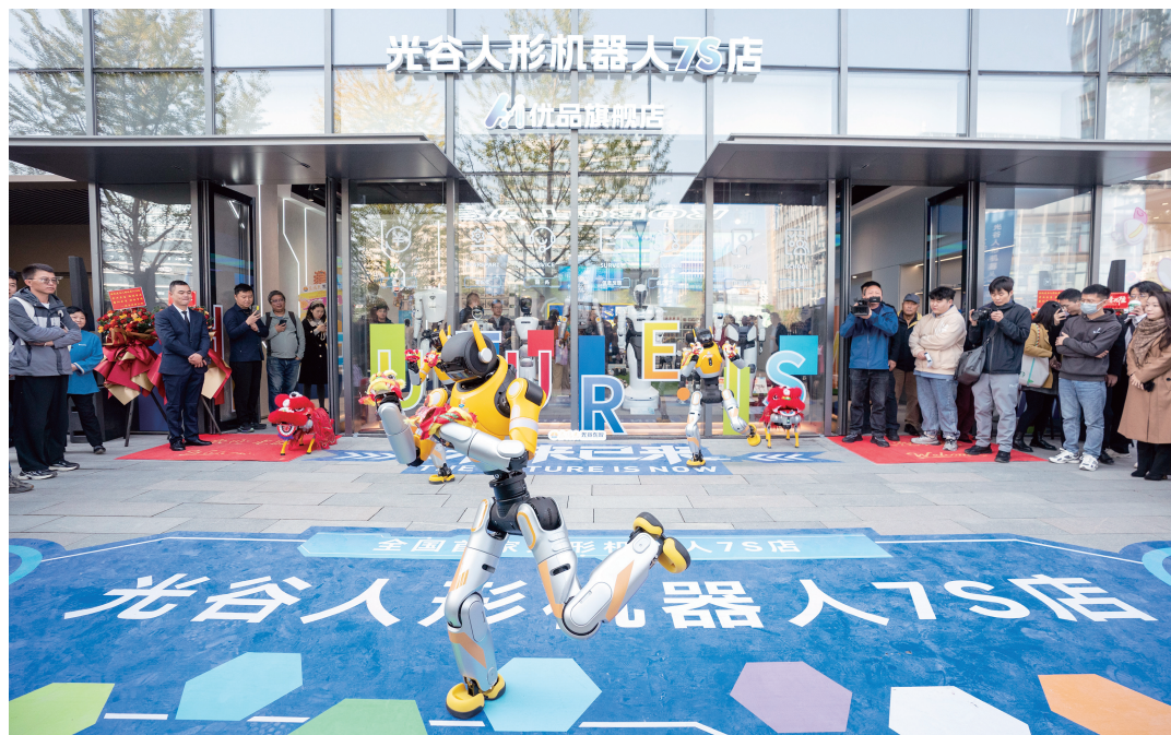
▲近年来，湖北抢抓数据驱动人工智能产业发展的战略机遇，着力打造全国人工智能产业发展新高地，为加快建成中部地区崛起的重要战略支点提供有力支撑。图为2025年11月11日，全国首家人形机器人7S店在光谷开业，湖北自研人形机器人家族集中亮相，开始明码标价走向市场。

(五) 夯实要素支撑基础，完善人工智能创新环境。一是加强数字新基建建设。适度超前布局工业互联网、5G-A 通信网、先进算力网等新型基础设施，夯实数实融合基础支撑。加快数据、算力、电力、网络等资源融合贯通，加快建设全省“1+3+N”的平台体系，推进“双千兆”网络向“双万兆”演进，建设高可靠、高性能、广连接的新型信息基础设施。推动新型信息基础设施深度赋能先进制造业集群应用，加快先进计算、千兆光网、工业互联网在先进制造业集群中的规模化应用。二是深化金融服务创新。推动智能化金融服务平台建设，为科技企业提供精准融资支持和风险预警服务，助力科技企业创新发