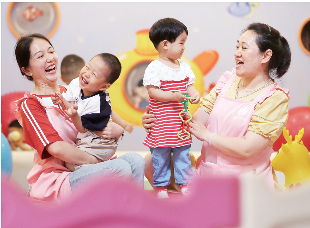
▲党的二十届四中全会作出“加大保障和改善民生力度，扎实推进全体人民共同富裕”的重要战略部署，为新时代民生工作指明了方向。近年来，我省始终将促进就业作为保障和改善民生的头等大事，推动就业形势总体稳定、稳中向好。图为荆门市东宝区泉口街道浏河社区托育服务中心，通过“妈妈岗”计划实现就业的保育员正在和孩子进行趣味游戏。

历史发展是连续性和阶段性的统一，一个时期有一个时期的历史使命和任务，一代人有一代人的历史担当和责任。把握规划的高度，就是登高望远、脚踏实地，就是目标远大、分步推进。从“一五”到“十四五”，中国共产党始终坚守建设社会主义现代化国家这一“五年规划”的主题，取得了建设社会主义现代化国家的伟大历史性成就。新征程上，必须牢牢把握规划制定和实施的高度，确保新时代中国特色社会主义、新发展阶段、中国式现代化、全体人民共同富裕伟大