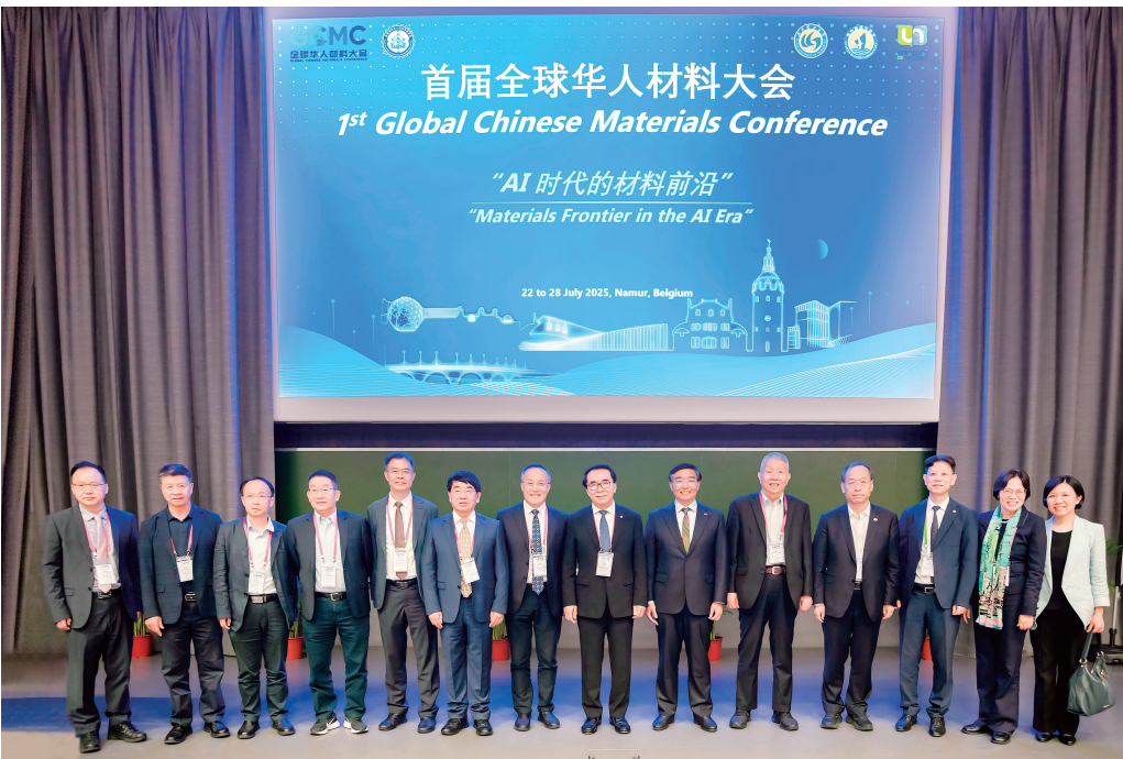
▲ 2025年7月，武汉理工大学与比利时那慕尔大学联合举办首届全球华人材料大会，来自近20个国家和地区的450名中外专家学者参会。

（一）构建全周期服务体系。精细服务，强化保障支撑。制定《人才服务工作规范》，建立校院领导直接联系服务人才机制。建立高层次人才“一站式保障”清单，落实人才科研启动