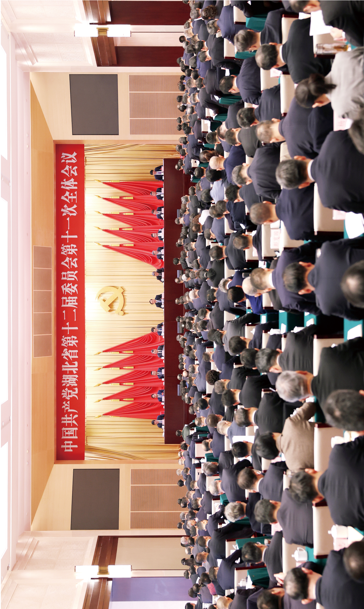
11月21日，中国共产党湖北省第十二届委员会第十一次全体会议在武汉举行。