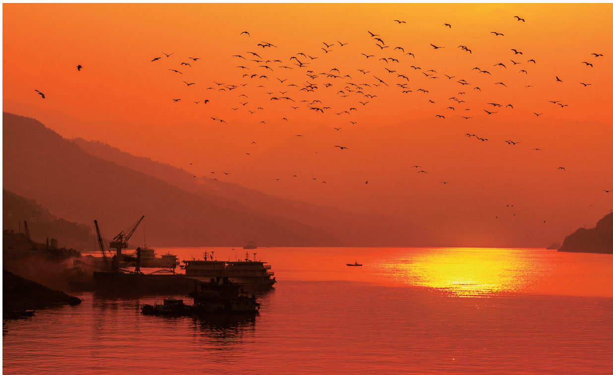
▲长江巴东段，霞光映江、白鹭翩翩，人与自然和谐共生。