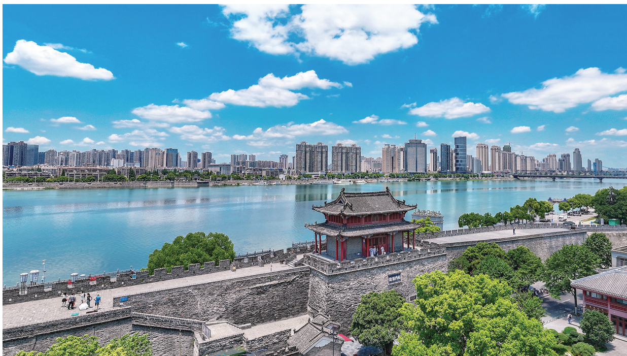
▲襄阳坚定不移走内涵式、集约化发展道路，统筹做好“治山、理水、营城、彰文”四篇文章，加快打造现代化人民城市。图为雨后的襄阳古城如诗如画。

角”。二是加快汽车产业转型升级。依托国家级车联网先导区优势，大力发展智能网联汽车，构建东风股份智能物流车、东风纳米智能乘用车、腾龙汽车智能公交多元品牌矩阵，推进“车路云”一体化建设；加快推动东风轩轾新能源整车项目落地，深度融入“汉孝随襄十”万亿级汽车产业走廊。三是推动煤磷化工一体化发展。坚持全域统筹资源要素，推动兴发磷化工产业园项目快建设，湖北联投磷煤氟、成都云图磷化工产业园等项目快开工，加快打造投资、产值“双千亿”的现代新型煤磷化工产业，努力成为湖北万亿级现代化工产业的重要一极、“襄荆荆宜”现代化工产业走廊的重要支撑。四是高水平创建国家农高区。抢抓我省出台22条举措支持襄阳创建国家农业高新技术产业示范区机遇，加快发展农产品精深加工、智能农机装备制造等产业，推动十大重点农业产业链提质增效，助力湖北打造新时代“鱼米之乡”。