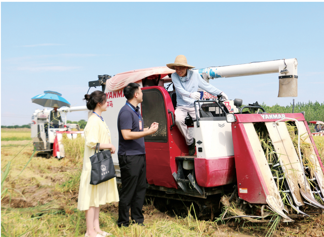
▲从监督执纪是党的自我革命的利器。枝江市纪委监委发挥派驻监督作用，深入一线开展实地监督，督促涉农部门加强履职服务。图为该市纪检监察干部深入田间地头开展调研。