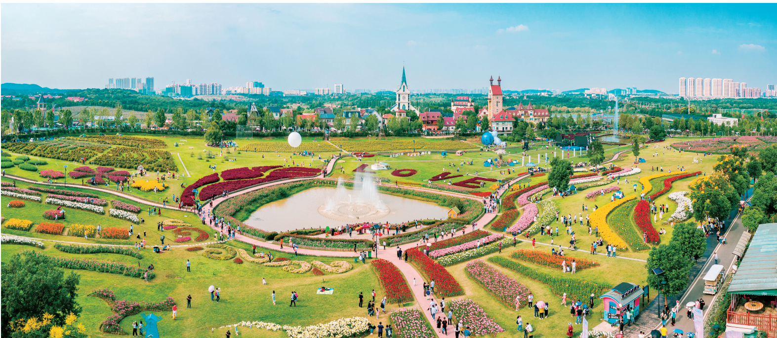
▲作为知音文化发源地，近年来，蔡甸区坚持走开放路、结全球知音，持续擦亮知音文化品牌。图为华中地区最大四季赏花景区——花博汇·知音花月夜。