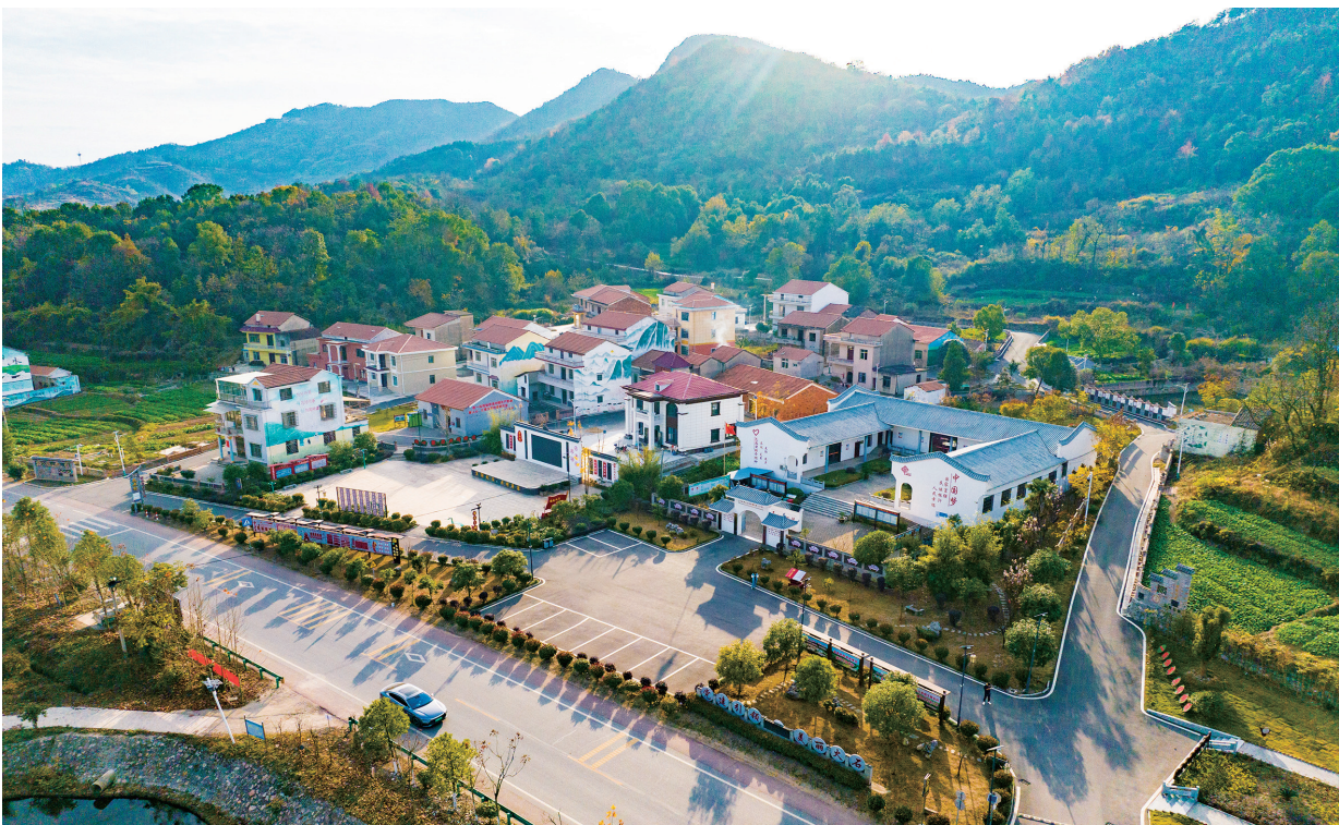
► 黄石市持续深化“清洁家园”行动，城乡环境整洁有序、焕然一新。图为大冶市金山店镇火石村。

三、坚持内外兼修、标本兼治，实现“外在美”到“内在美”。 深入践行“绿水青山就是金山银山”发展理念，统筹生产、生活、生态融合发展，推动和美乡村建设迭代升级，让人们望得见山、看得见水、记得住乡愁。一是与绿色农业