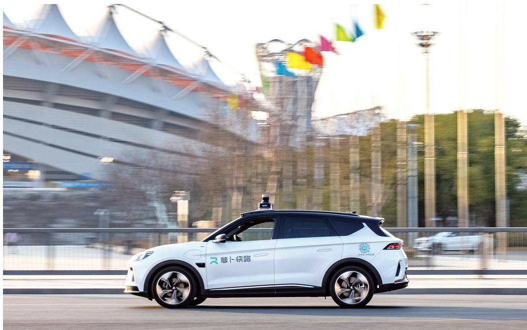
▲近年来，武汉市大力推进智能网联汽车发展，无人驾驶商业化运营实现了跨区通行、跨江通行、机场高速通行等多个自动驾驶商业应用场景的全国创新突破。图为无人驾驶汽车行驶在武汉经开区路段。

一是坚定不移推进转型发展，加快提升城市能级和核心竞争力。全力打好汽车、钢铁、化工转型三大战役，加快光电子信息、高端装备制造、军工等优势产业发展壮大，深入开展“人工智能+”行动，推进人工智能规模化商业化应用，加快构建体现武汉优势的现代化产业体系。