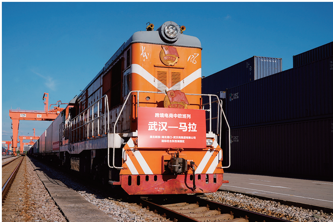
▲2025年7月1日，一列跨境电商出口专列从中铁联集武汉中心站驶出开往波兰马拉舍维奇。此跨境电商专列由湖北联投集团、湖北港口集团和中国铁路武汉局集团有限公司共同组织发运。

(二) 加快实体转型，转换发展动能。筑牢精细化工“压舱石”。累计持有矿业权66宗，磷矿资源储备超10亿吨，加快推进襄阳宜城磷煤氟一体化产业基地建设，总投资300亿元，2027年上半年实现一期项目投产，预计实现产值100亿元、上缴税收7亿元。抢占新能源“制高点”。推动“风光水火储一体化”“源网荷储一体化”，