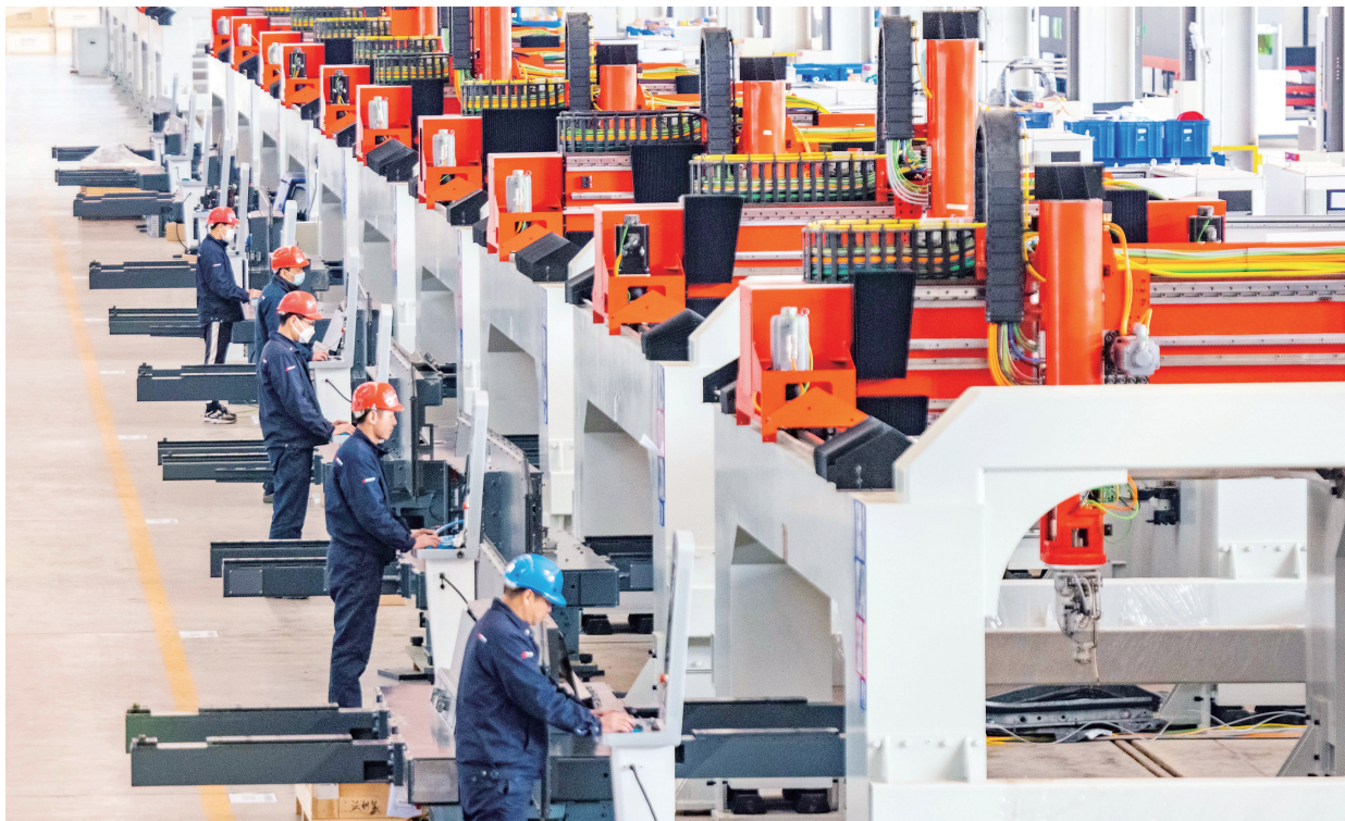
▲湖北坚持统筹好科学研究与技术转化，推动创新成果加快变成产品、落地为产业、转化为新质生产力。图为由华中数控联合华工科技、国家智能设计与数控技术创新中心研发的国内首条三维五轴激光切割装备智造生产线。

强化平台支撑，着力做强高能级科技力量矩阵。抢抓国家战略腹地建设、科技力量优化重组等重大机遇，全面实施高能级科创平台培育工程。省部共建完善实验室体系，推动45家国家重点实验室高质量运行，推动湖北实验室在化合