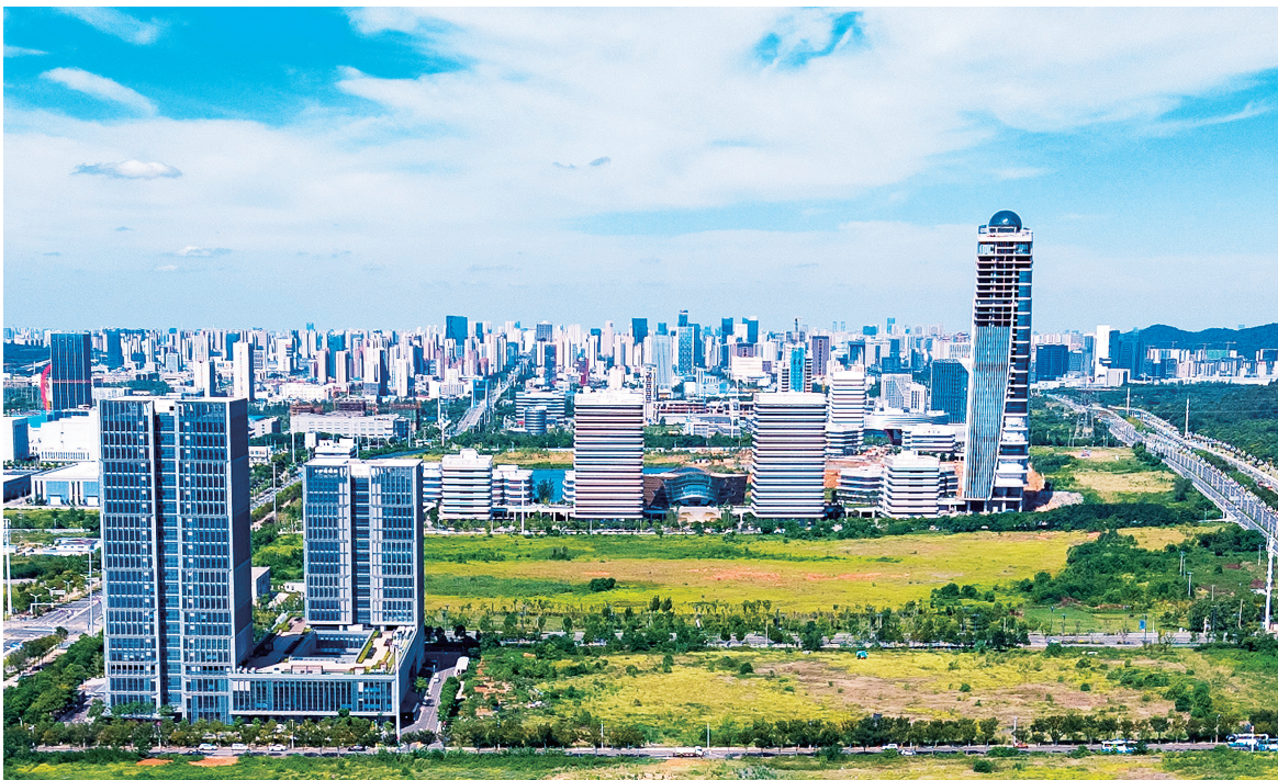
▲近年来，我省系统推进数字化湖北行动计划，实施数字经济“五新工程”，数据要素市场化配置改革开启新征途，数字经济综合实力迈入全国第一梯队。图为中国光谷·数字经济产业园。

战略性新兴产业集群和国家级创新型产业集群均居全国前列。要高标准建设具有全国影响力的科创中心，夯实在国家创新体系中的地位。