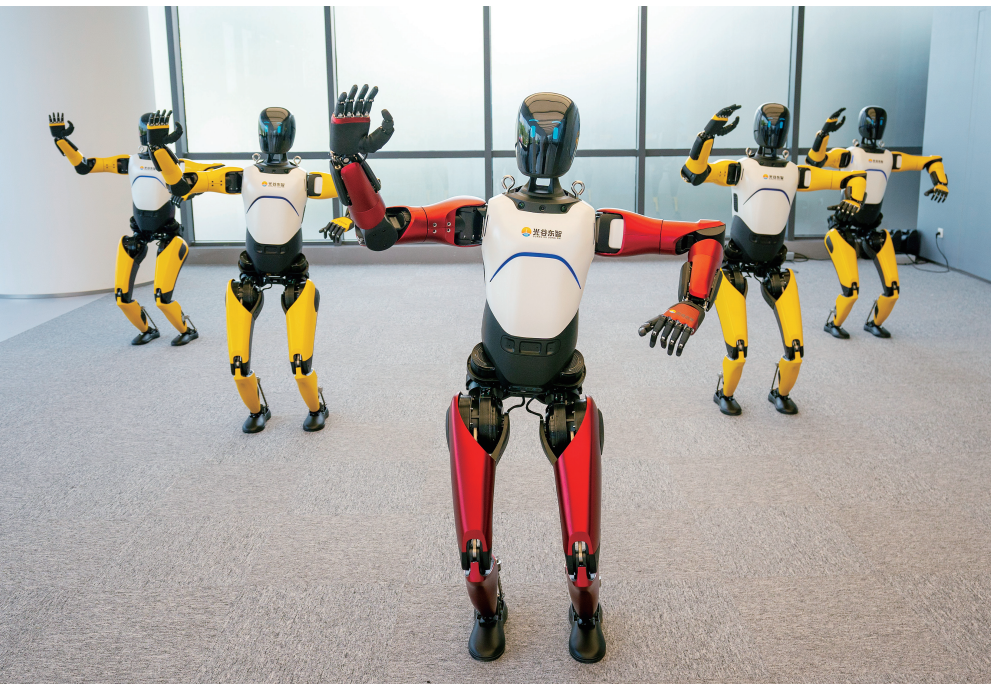
▲近年来，我省创新策源能力持续增强，科技自立自强迈出坚实步伐。图为湖北人形机器人创新中心的“楚才”系列人形机器人。

意见，科技成果转化效能明显提升，上半年全省技术合同成交额达到 3187 亿元，同比增长 10.55%。科技金融服务不断优化，新设各 10 亿元的高校科技成果转化、重点区域和重点行业领域科创种子基金，累计向 12526 家科技型企业发放知识价值信用贷 611 亿元。深入实施战略人才力量“十百千万”行动，支持 117 名青年科技人才承担重大科技项目、80 名科技人才服务企业创新一线，推进国家科技人