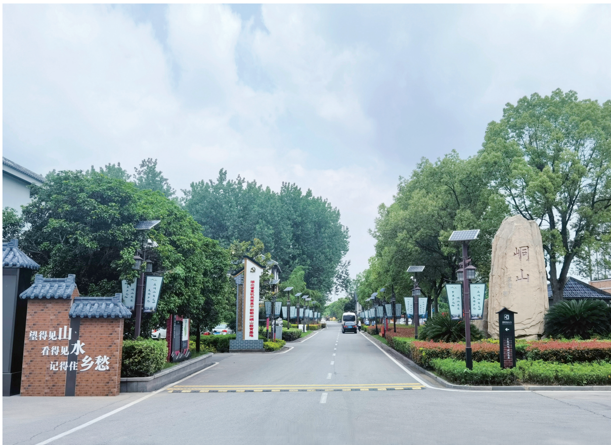
▲鄂州峒山村村容整洁，绿树成荫。

在村“两委”推动下，峒山村发布“峒山”区域公用品牌，包括峒山香米、莲子、莲心荷叶茶三大农副产品和峒山客舍、栖客露营基地、西岭别院、峒山葡萄园、田间博物馆等十大旅游研学场景，打造了峒山宴、峒山宿等乡愁示范品