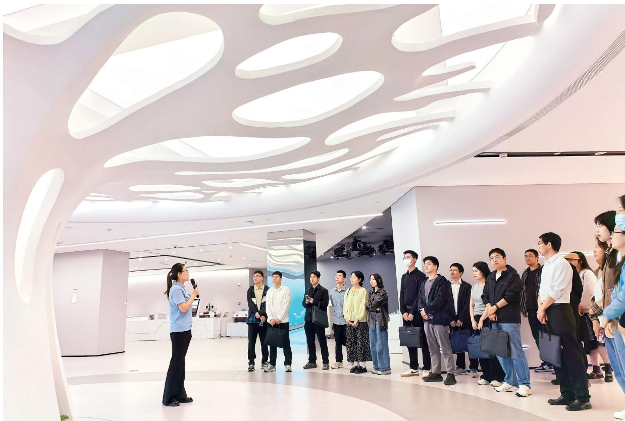
▲武汉市深入实施“干部专业能力提升计划”，对市直重要经济部门的年轻干部采取理论研学、导师领学、岗位跟学、异地访学等培养举措，全面提升其专业能力素质。图为武汉市科技创新局组织年轻干部赴武创院开展实地调研学习。

求，围绕加快把武汉的科教人才优势转化为创新发展优势的目标，将深圳作为武汉对标学习城市，由市领导带队开展学习调研。立足“快于、好于、优于、强于”同类对象，推动各区、各高校、各企业全覆盖确定对标对象并制定具体措施，确保各项工作争先进位。二是聚焦“关键少数”谋发展。发挥“关键少数”示范引领作用，在《长江日报》、武汉广电《武汉新闻》开设“牢记嘱托 建成支点”区委书记和委办局长访谈专栏，16位区（开发区、功能区）党（工）委书记围绕支点建设和“七大战略”谈思路、谈举措、谈发展，17位市直重点委办局主要负责同志谈落实安排和创新举措。三是聚焦凝聚共识促合力。印发《关于在全市范围开展“对标争先