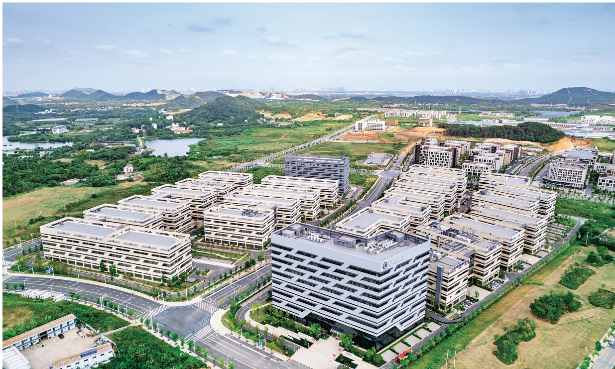
▲当前，湖北正大力实施产业倍增战略，做大做强“51020”现代产业集群，加快构建体现湖北优势的现代化产业体系，夯实支点建设的坚实底盘和有力支撑。图为武汉光谷南大健康产业园。

近年来，湖北有力应对“一难两难多难”复杂局面，深刻把握科学思想方法和工作方法，克服疫情反复延宕、低温雨雪冰冻灾害等多重挑