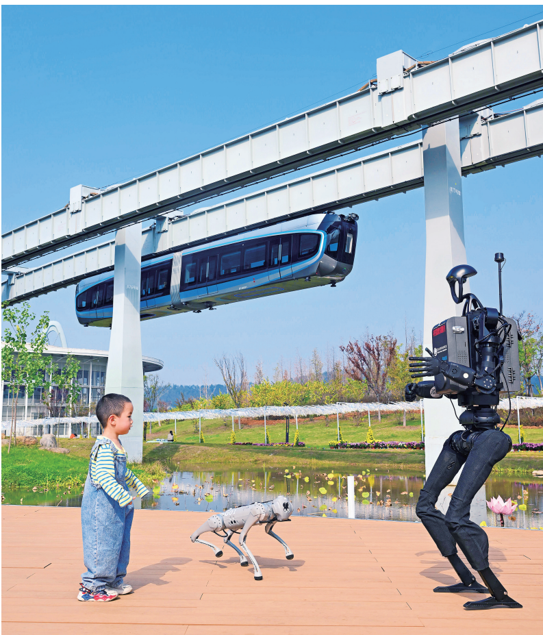
▲新质生产力是推动高质量发展的内在要求，而科技创新则是发展新质生产力的重要驱动力。图为武汉东湖高新区空轨高新大道站，人形机器人乘空轨、看AI展、与小朋友共舞。

改革开放以来，我国经济总量失衡的主要矛盾及矛盾的主要方面长期偏于需求侧，相应地实施了以需求管理为主的宏观调控，或适度紧缩总需求，或以扩大内需为目标刺激总需求。进入新常态，我国经济运行中供求两端都发生深刻变化，供需关系出现新的重大结构性失衡的突出矛