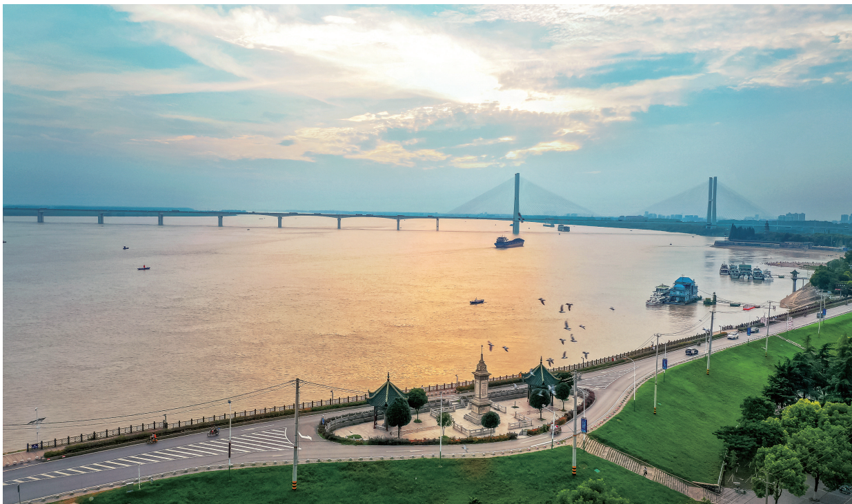
▲万里长江，险在荆江。在历次长江特大洪水中，荆江都是灾情严重的河段。随着三峡工程蓄水调洪和两岸堤防加固，荆江区域防洪能力得到极大提升。图为荆江大堤荆州市中心城区堤段。

事业。当前，荆州和全省一道进入跨越赶超关键期、转型升级突破期、内生动力迸发期、枢纽地位重塑期、干事创业黄金期。站在新的历史起点上，面对“一难两难多难”“既要又要还要”的复杂局面，必须坚持不懈做好抗洪精神深化、内化、转化工作，凝聚强大正能量。