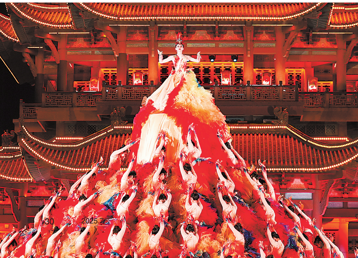
◀ 2025 年中央广播电视总台春节联欢晚会武汉分会场凤凰舞片段。凤凰于黄鹤楼前振翅，呈现浴火重生之姿，展现了荆楚文化乐观坚韧、生生不息的特质与英雄湖北顽强拼搏、舍生忘死的时代精神。

在荆楚文化中，舍生忘死绝非逞匹夫之勇，盲目牺牲，而是其义利观与生死观的极致融合——是以“义”为圭臬的无畏抉择，是危难之下挺身而出的英雄气概，是超越生死利害的终极抉择，是“不服周”的必胜信念。革命斗争中，大别山革命先烈坚守信念、不怕牺牲，用鲜血诠释了舍生取义的真谛；抗洪斗争中，无数军民不怕困难、顽强拼搏，以血肉之躯筑起生命防线；