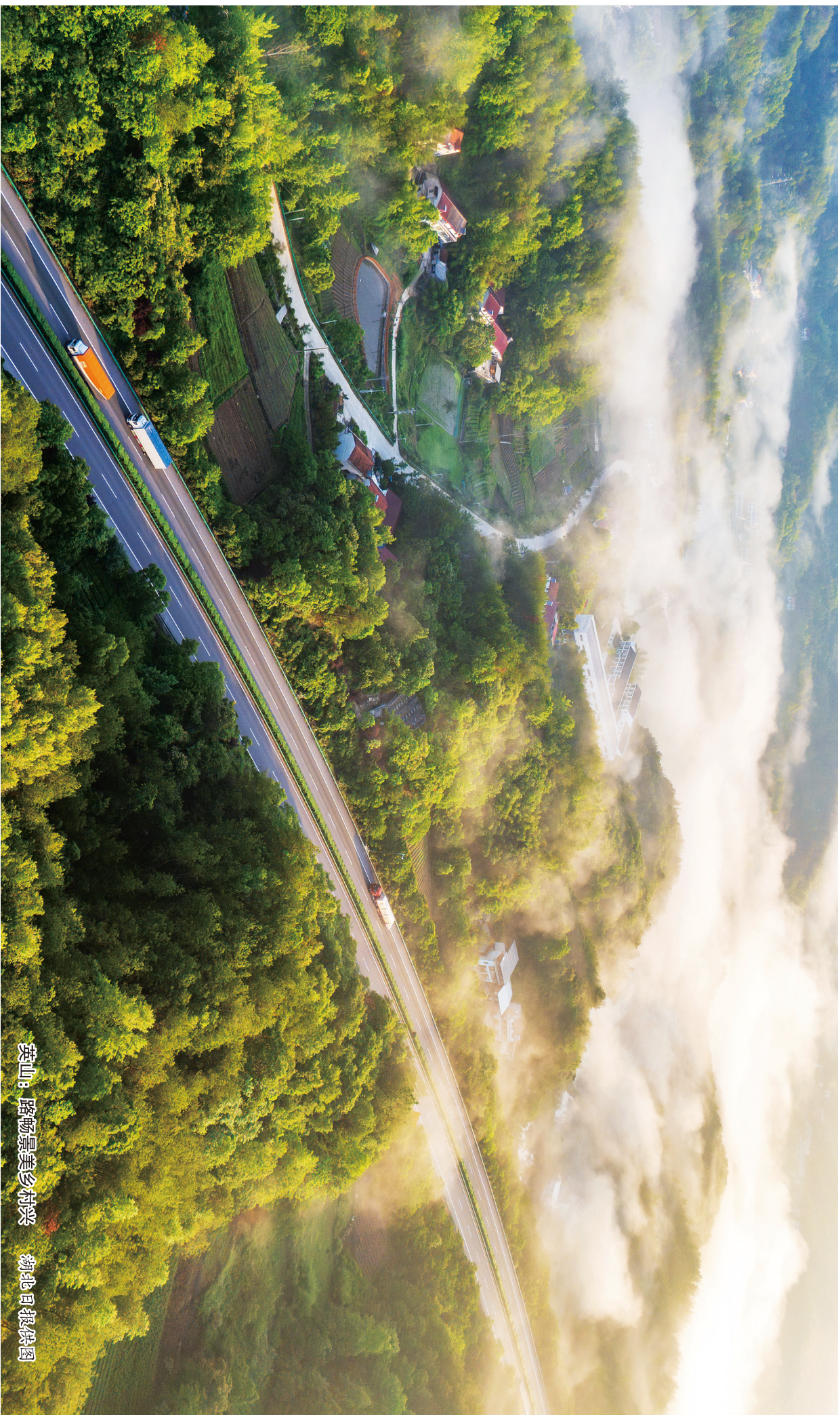
英山：路畅景美乡村兴

国际标准刊号/ISSN 1005-7455 国内统一刊号/CN42-1350/D 定价/10.00元