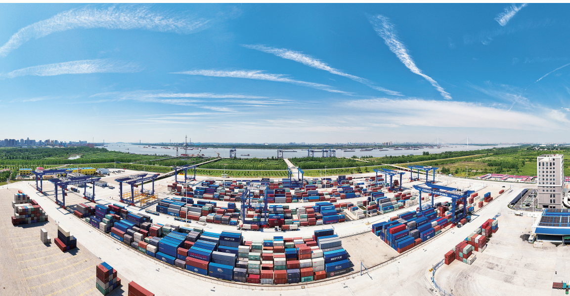
▲ 交通物流枢纽是延长产业链的关键一环。中远海运 CSP 武汉码头相继打通至欧洲、东南亚等地的多条“铁海联运”通道，为区域经济发展和物流体系升级注入动能。