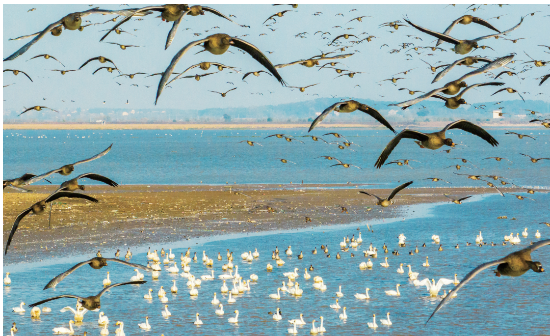
▲黄梅县龙感湖畔万鸟翔集，尽显生态之美。

对标建成“生态环境优渥”的生态支点定位，湖北还存在“绿色屏障韧性有待进一步增强、绿色动能潜力有待进一步释放、绿色机制活力有待进一步激发”等不足。必须保持战略定力，加快美丽湖北建设，深入推进长江大保护、全面推进绿色低碳发展、积极争创美丽中国先行