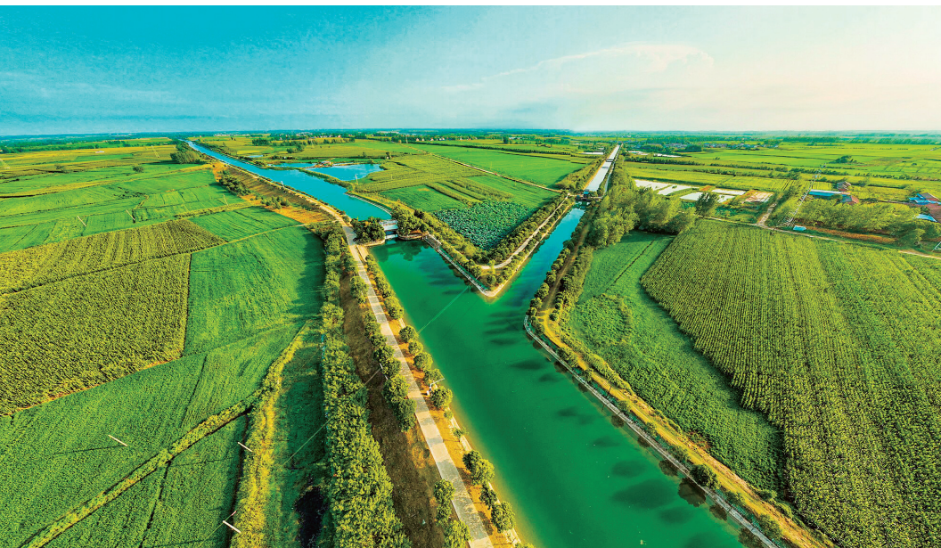
▲老河口清清丹渠水源不断向当地灌区输送。