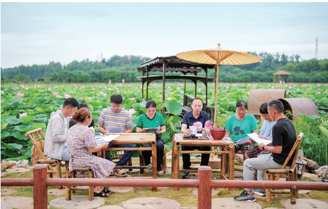
▲作风建设的最终成效如何，人民群众最有发言权。嘉鱼县积极搭建群众议事决策监督平台，保障群众对村务管理的知情权、参与权、监督权。图为该县新街镇纪委干部组织群众对项目资金使用、基层干部作风等事项开展公开评议。

(二) 强化使命担当。党的作风建设不是孤立存在的，而是深深植根于党的事业发展土壤、紧密服