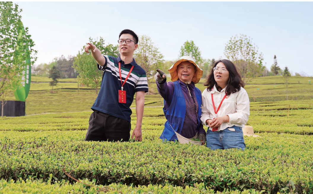
▲开展深入贯彻中央八项规定精神学习教育以来，我省各级纪检监察机关着力解决群众急难愁盼问题，惩治“蝇贪蚁腐”，推动纠风治乱，使作风建设成果惠及群众。图为五峰土家族自治县纪检监察干部在某茶产业基地了解惠农政策落实情况。

手中，我们就要对党、对国家、对民族、对人民负责，就要敢于同破坏党的领导、损害党的肌体的行为作斗争，否则我们就会成为历史的罪人”，表达的是担当使命的毅然决然态度；强调“制定实施中央八项规定，是我们党在新时代的徙木立信之举，必须常抓不懈、久久为功，十年不够就二十年，二十年不够就三十年，