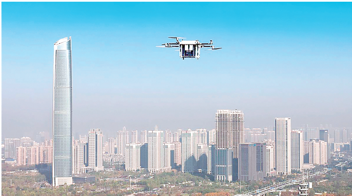
▲低空经济是未来发展的新赛道之一。近年来，我省全面布局，积极推进低空经济高质量发展。图为一架装载有800毫升血液的无人机从武汉血液中心飞往武汉亚心总医院。

经济全面提速。数字经济发展水平跃居全国第七、中部第一，算力网络运载力全国第三、中部第一。然而，距离现代产业引领还有一定发展空间。一是传统产业转型压力较大。汽车、钢铁等传统支柱产业仍处于转型阵痛期，新能源汽车产量仅居中部第四。二是现代农业发展水平不高。农产品精深加工占比不高、龙头企业实力不强，国家级龙头企业数量与河南、安徽等省份存在差距。三是文旅产业发展不够。2024年全省旅游总收入9007亿元，低于湖南、河南、安徽等省份，人均旅游消费仅居中部第五。