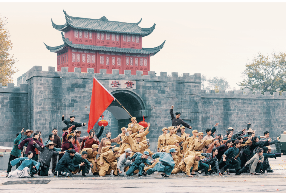
▲为弘扬大别山精神，传承赓续红色血脉，黄冈市运用群众喜闻乐见的方式，先后创作20多部文化小剧。图为大型红色实景剧《红安永远红》剧照。

作为“主心骨”和领路人，胸怀革命必胜的坚定信念，铁心跟党走，九死而不悔。在新的历史时期，我们要以革命先辈为榜样，始终在政治立场、政治方向、政治原则、政治道路上同以习近平同志为核心的党中央保持高度一致，坚定拥护“两个确立”、坚决做到“两个维护”。