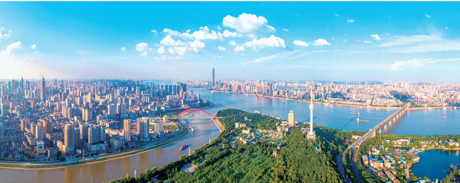
▲两江奔涌，三镇鼎立，极目楚天阔。 图为武汉市两江四岸风光。

亿元、增长 8.7%，全市实现旅游收入 4200 亿元、增长 11.2%，文化旅游业日益成为武汉新的重要增长极。一是整合资源、打造品牌，着力拓展武汉文旅发展新空间。围绕打造长江文旅品牌，推动黄鹤楼公园等核心区域资源整合，推进汉口历史风貌区、武昌古城、汉阳古城等整体规划重塑，昙华林、黎黄陂路等获评国家级旅游休闲街区，知音号游轮、夜游黄鹤楼等成为夜间文化新亮点。2022 年以来全市推进建设文旅领域重大项目 42 个，武汉持续位列全国十大热门旅游目的地。二是创新驱动、优化供给，着力塑造武汉文旅发展新优势。持续推进文旅业态创新、模式创新、技术创新、产品创新，打造全链条消费场景，大力发展赏花经济、演艺经济、赛事经济、会展经济，“汉马”“武网”等重要节会活动影响力不断提升，“跟着春晚游武汉”“相约春天赏樱花”等活动流量爆棚。近 3 年来汉游客分别达 2.1 亿、3.3 亿、3.6 亿人次，武汉文旅综合带动效应持续释放。三是深化改革、汇聚合力，着力激发武汉文旅发展新活力。