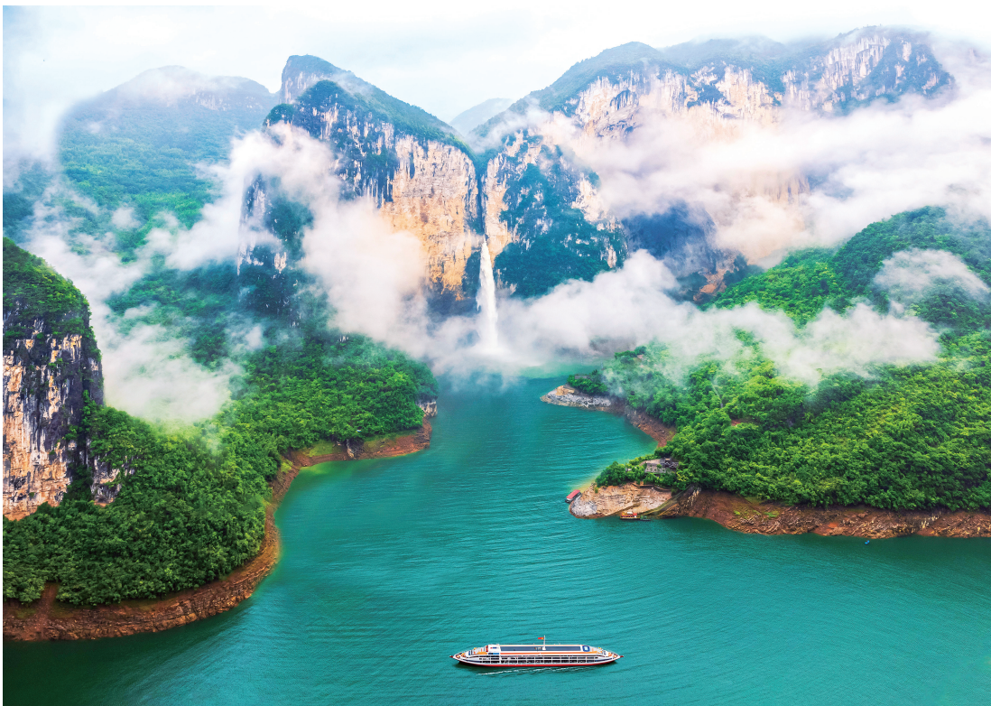
▲当前，湖北正加快建设世界知名文化旅游目的地，推动文旅产业加速迈向万亿级。 图为恩施清江蝴蝶崖景区。

谷和大黄鹤楼等5家世界知名旅游景区和20家5A级旅游景区、100家特色精品景区，构建“520100”景区品牌体系。在“线”上，重点推出“神武峡”“赤黄红”两大主轴旅游线路，鼓励各地集中优势资源推出若干特色鲜明的主题旅游线路，满足市场多样化需求。在“面”上，重点支持武汉和襄阳、宜昌、十堰、恩施等地建设国际特色旅游城市，形成全域联动的发展格局。二是提升文旅供给竞争力。深入实施文旅产业升级行动，从供给侧提升文旅产业竞争力。汇聚全球资源。面向全球引入文旅企业、文化娱乐、节事赛会等资源，推出更多让人“看一眼就心动”“来一次还想来”的文旅产品和特色服务。突出数字赋能。依托重点景区、休闲街区、工业遗址和文博场所，打造虚实共生新场景，激活沉浸式体验“数字引擎”。拓展产品业态。发展“文