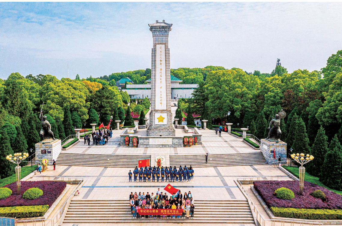
◀ 黄麻起义和鄂豫皖苏区纪念园内有“一碑一墙两场三园五馆”，是全国重点烈士纪念建筑物保护单位、全国爱国主义教育示范基地。

区党和人民，敢于斗争、敢于胜利，“将革命进行到底”的意志品质和精神风貌。“勇当前锋、不胜不休”与弘扬斗争精神、增强斗争本领的实践要求同归，为新时代党员干部在复杂形势下应对各种风险挑战提供了丰富的历史经验和精神财富。奋力谱写中国式现代化湖北篇章，需要我們继续发扬勇当前锋的敢闯敢拼精神，继续发扬不胜不休的昂扬斗志和坚韧革命意志。