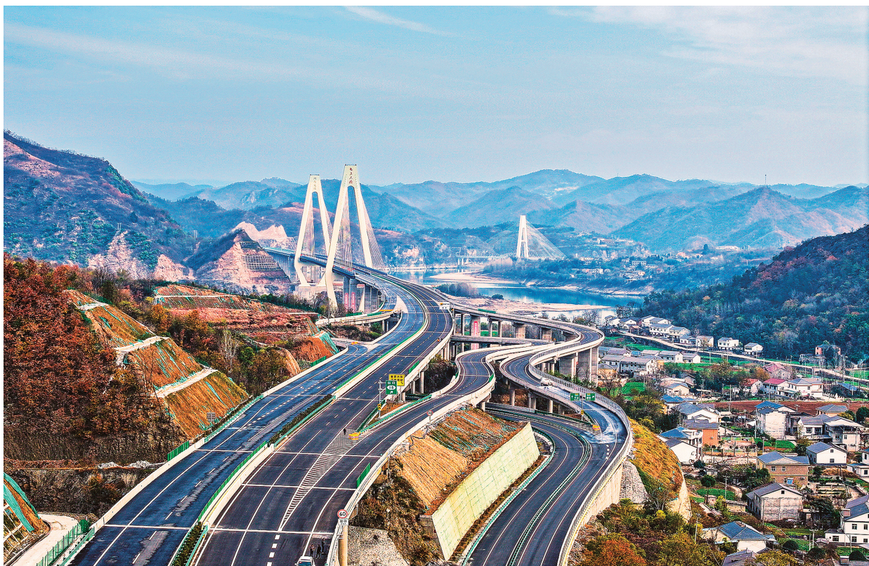
▲2025年3月7日，十巫（湖北十堰至重庆巫溪）北高速通车试运营。十巫北高速填补了十堰西南部地区南北向高速公路空白，对优化鄂豫陕渝毗邻地区路网结构、带动沿线地区资源开发利用及周边地区经济社会高质量发展具有重要意义。

推动成果转化。积极开展“企校双进”，引导湖北汽车工业学院、湖北工业职业技术学院等高校壮大科技力量矩阵，常态化与企业开展产学研合作。密切“京堰协作”，持续组织“北京院士专家十堰行”活动，定期举办专家、企业家、投资者三方沙龙，推动科技创新成果就地交易、就