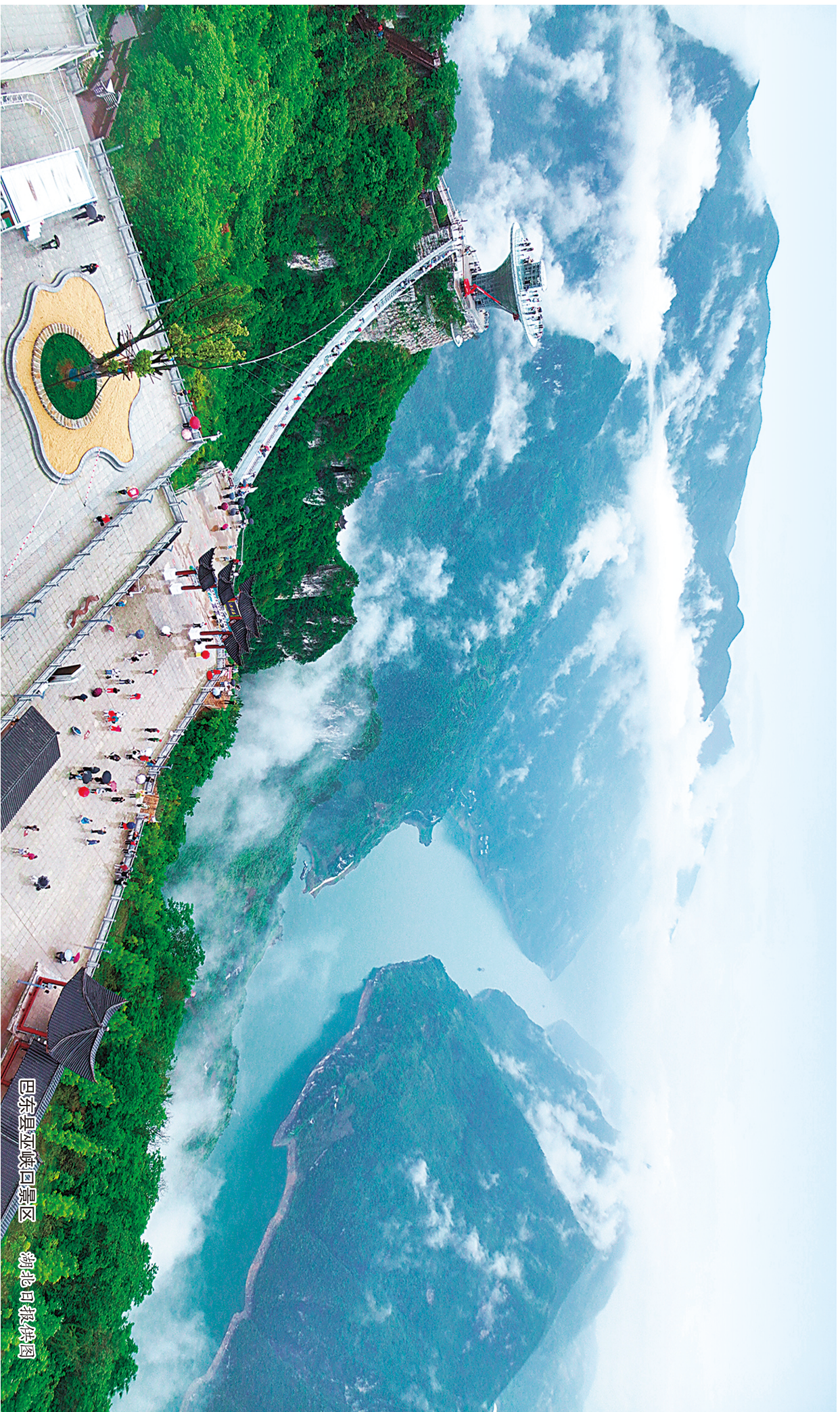
巴东县巫峡回景区

国际标准刊号/ISSN 1005-7455 国内统一刊号/CN42-1350/D 定价/10.00元