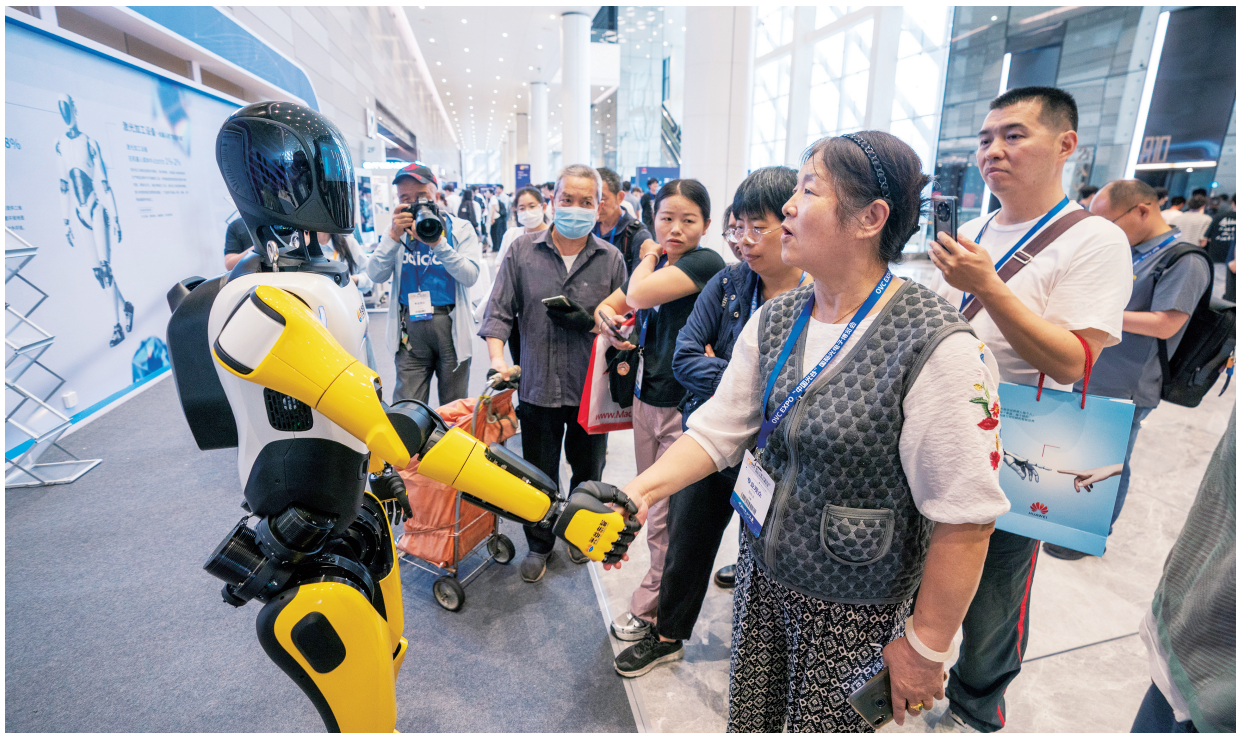
▲坚持创新发展是应对发展环境变化、增强发展动力、把握发展主动权的根本之策。图为2025年5月16日，第二十届“中国光谷”国际光电子博览会在光谷科技会展中心举办。

理政的第一要务。党的十八大以来，以习近平同志为核心的党中央牢牢把握我国社会主要矛盾发生转变和经济发展资源供给条件环境等发生巨大变化，深刻总结国内外发展经验教训，围绕解决我国经济发展进入新常态面临的突出矛盾和问题，在党的十八届五中全会上首次提出创新、协调、绿色、开放、共享的新发展理念。此后，习近平总书记就新发展理念发表一系列重要论述。强调，“发展必须是科学发展，必须坚定不移贯彻创新、协调、绿色、开放、共享的发展理念”。新发展理念的提出，标志着我们党对新时代经济工作的规律性认识达到一个新的高度。2017年中央经济工作会议首次提出，我们党形成了以新发展理念为主要内容的习近平新时代中国特色社会主义思想。