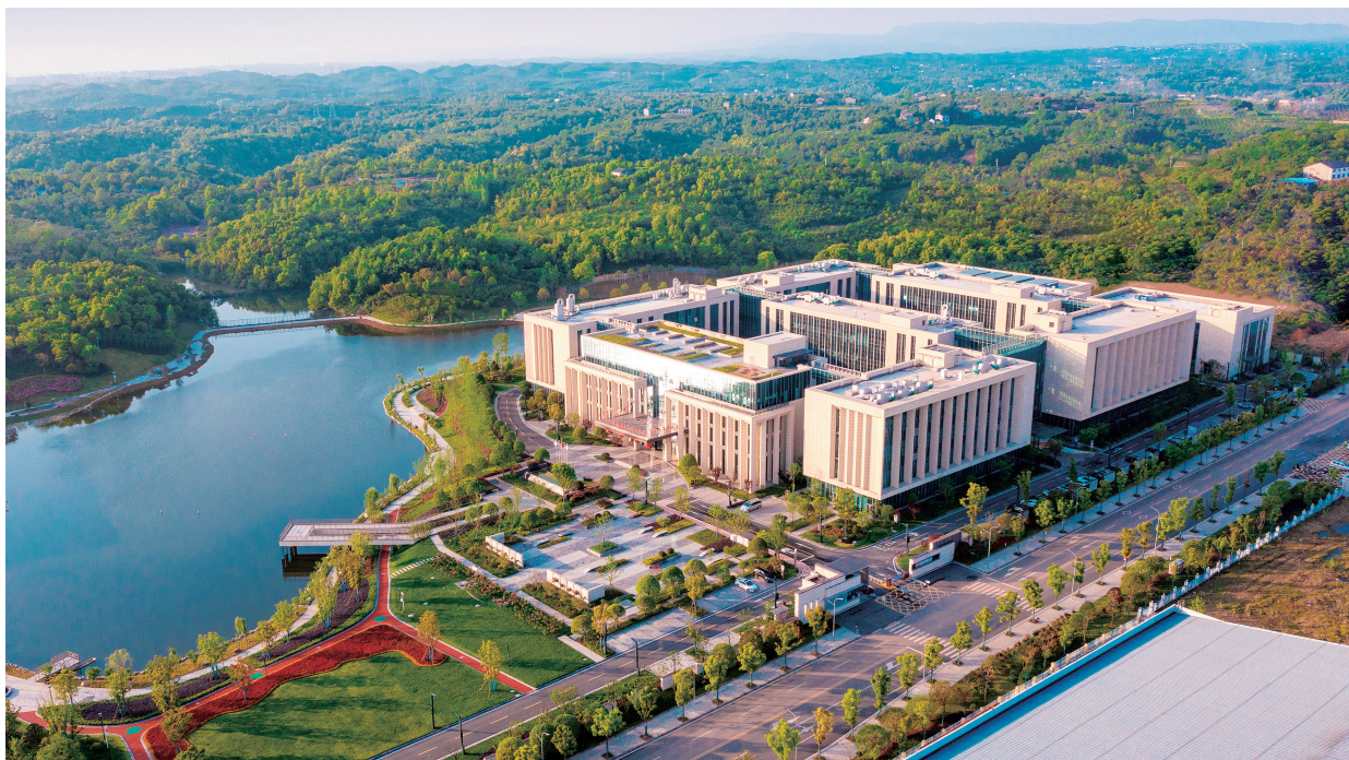
▲湖北三峡实验室围绕“碳中和”与“碳达峰”的双碳目标，致力于基础研究、应用基础研究和产业化关键核心技术研发，在芯片用电子级磷酸、高性能蚀刻液等“卡脖子”技术攻关上取得成效。

长期以来，宜昌市高度重视企业发展，为企业营造良好发展环境，服务支持企业。一是夯实现项目支撑。宜昌市建立“五个一”产业链招商机制，即“一个龙头企业+一个产业链条+一个发展片区+一个配套政策+一个评估团队”，有效推动招商项目落地。2024年，依托龙头企业招引项目28个，签约投资金额586.85亿元。建立市级领导领衔的“四个重大”项目服务机制，在全省首创重大项目“指挥部+工作专班”全生命周期管理服务，以最短时间、最快效率落实企业诉