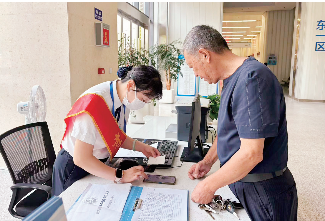
▲近年来，各级机关积极转变管理方式，优化政务服务，提升工作效能，为群众提供更加便捷、高效的服务。图为孝感市政务服务中心工作人员帮助老人缴纳城乡居民医保。