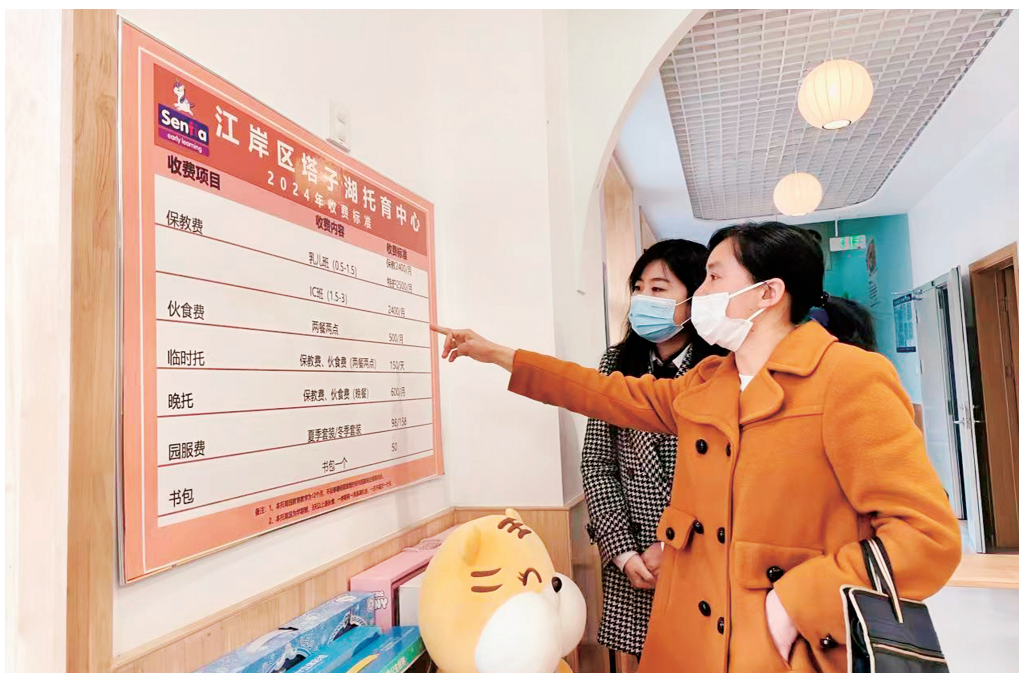
▲省审计厅以审计力度呵护民生温度，用审计担当为支点建设凝心聚力。图为审计人员查看社区托育中心运营管理情况。

(三) 客观容错纠错，激发担当作为。将容错纠错植入审计执法理念、嵌入审计工作流程、融入审计价值取向，让审计既有力度、准度，也有温度，激励引导广大干部在支点建设中大胆闯、大胆试、大胆干。完善容错纠错机制，规范