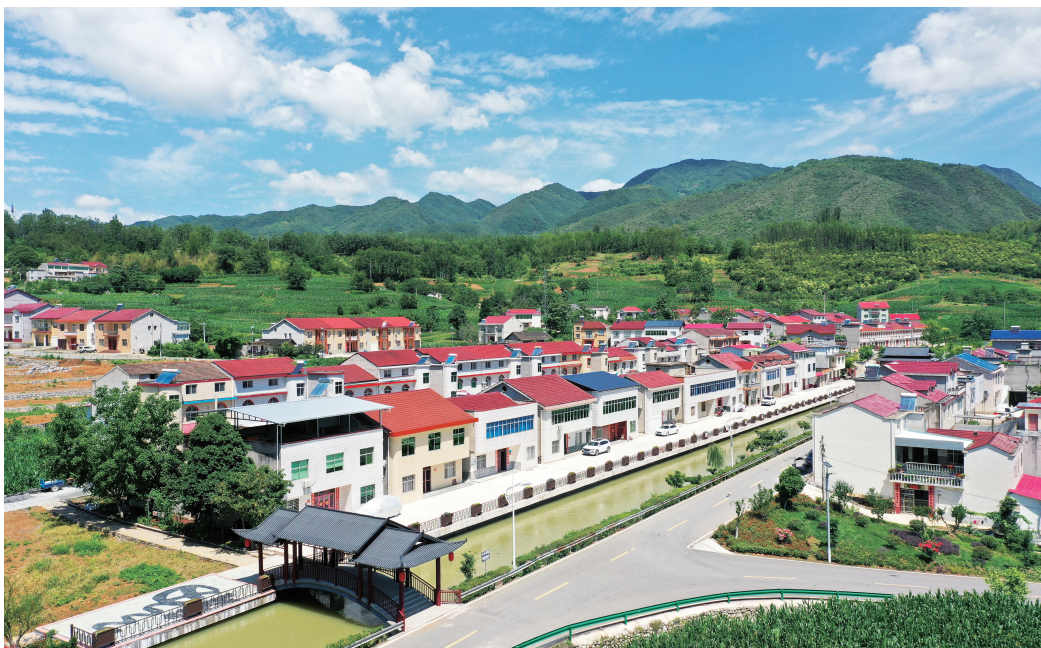
▲保康县马桥镇中坪村村貌。

在中坪村千家万户。如今的中坪村，精打细算、勤俭节约已成为家家户户的行为自觉；“婚事新办、丧事简办、其他不办”已形成村民共识；尊老孝亲、家庭和睦已成为时代风尚；邻里互让、互帮互助已养成良好习惯；公益事业人人有责、人人参与已蔚然成风。三是运用“铁匠作风”促发展。中坪村以“小规约”为抓手，优化发展环境，提速发展质效，绘出了一幅共建、共治、共享的乡村治理幸福画卷。村“两委”团结带领全体村民大力发展磷矿、水电、葛根等产业，实现集体增收、村民致富。2024年，全村实现工农业总产值6亿元，集体经济收入达到1.6亿元，