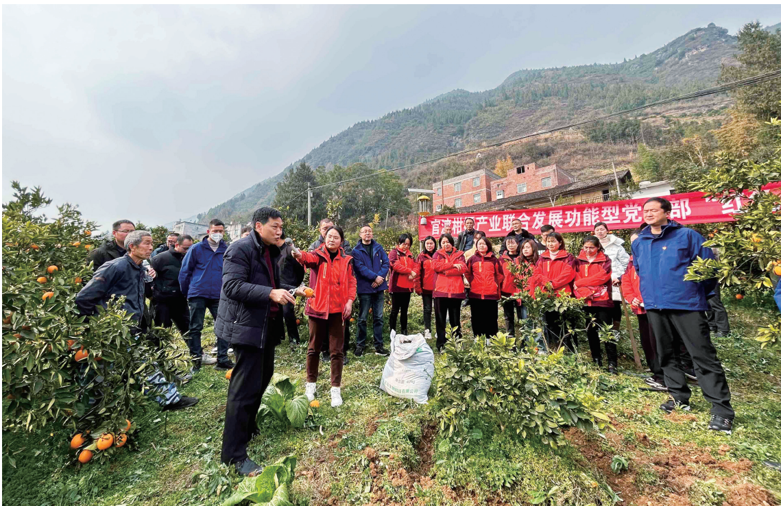
◀巴东县官渡镇坚持抓党建促乡村振兴，创新成立柑橘产业联合发展功能型党支部，定期组织开展柑橘产业相关技能培训。图为技术人员现场传授柑橘种植管理经验。