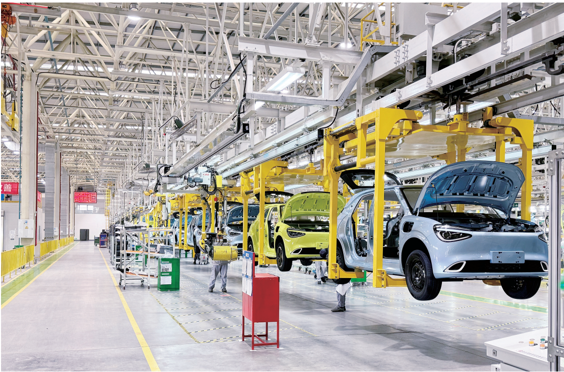
▲2024年11月，襄阳东风纳米01新能源汽车产量首次破万辆大关，引领全市传统汽车产业加快转型升级。