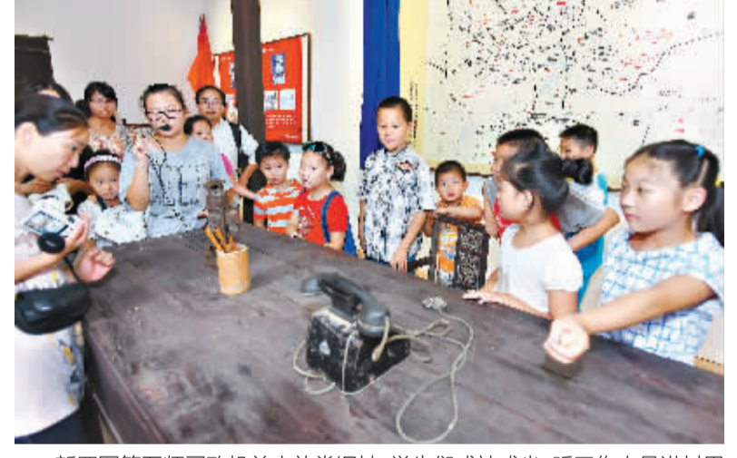
新四军第五师司政机关大礼堂旧址,学生们或站或坐,听工作人员讲村里的抗战故事

1940年5月,新四军鄂豫挺进纵队进驻姚家山后,修了大礼堂,设立了印刷厂、医院、枪械所、被服厂、卷烟厂、榨油厂等。新四军驻村时,姚世高还不到10岁。但他记得,新四军和村民几