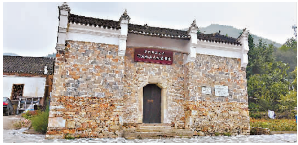
新四军第五师司政机关大礼堂旧址