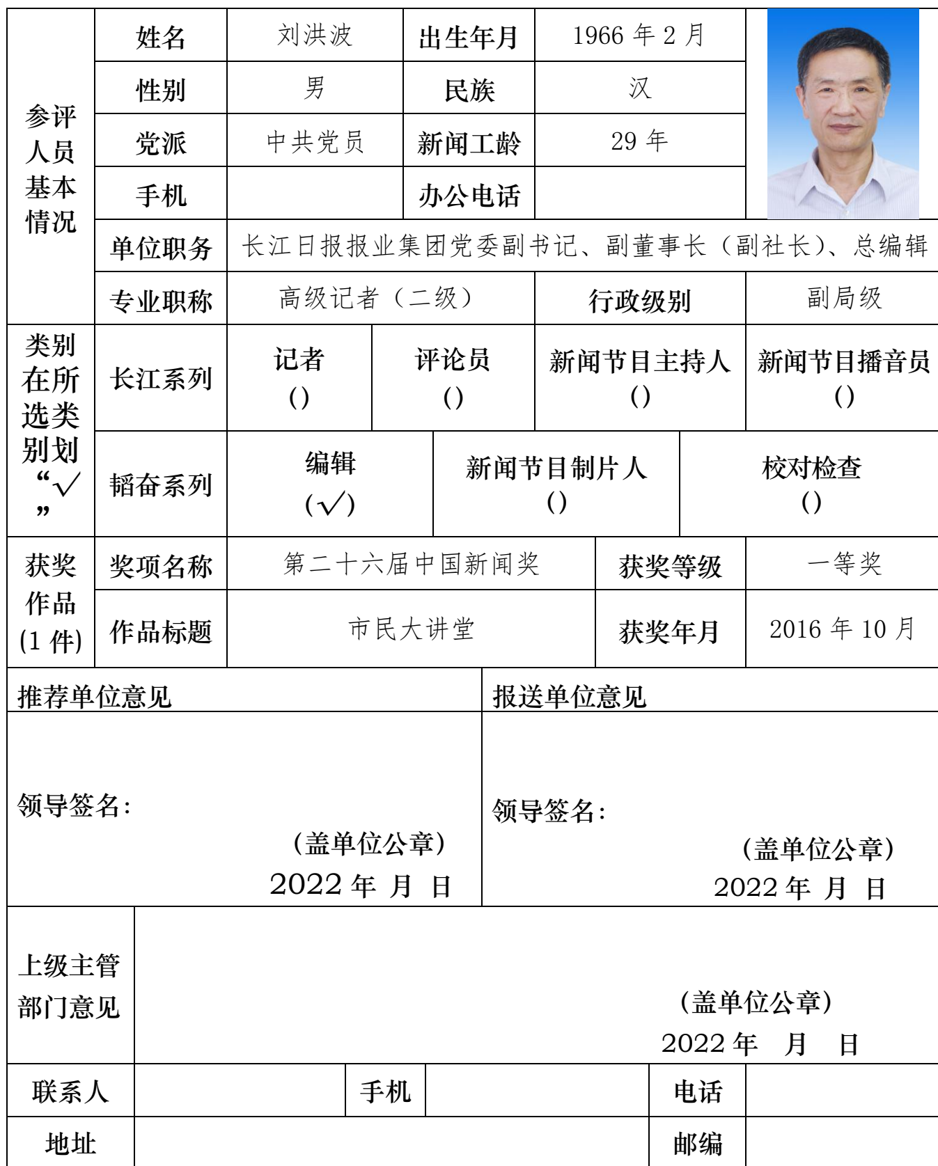
长江韬奋奖参评人员推荐表